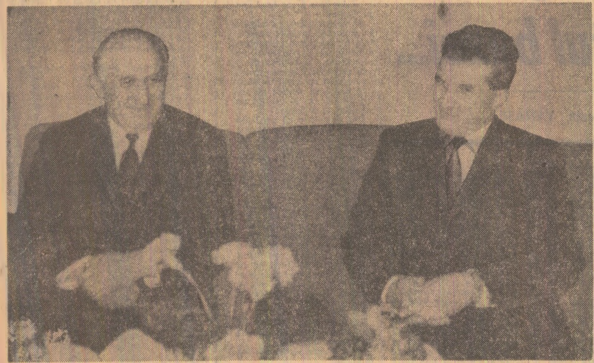
În timpul vizitei protocolare

Astăzi, 19 noiembrie, în jurul orei 16,00, posturile noastre de radio și televiziune vor transmite direct, de la Sofia, mîlungul organizat cu prilejul vizitei oficiale de prietenie a delegației de partid și guvernamentale a Republicii Socialiste România, condusă de tovarășul Nicolae Ceaușescu, secretar general al Partidului Comunist Român, președintele Consiliului de Stat al Republicii Socialiste România.