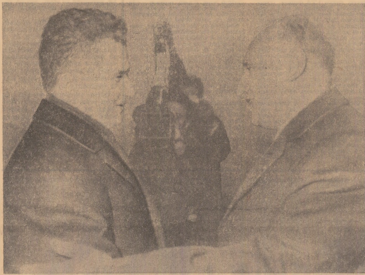
La sosirea pe aeroportul din Sofia