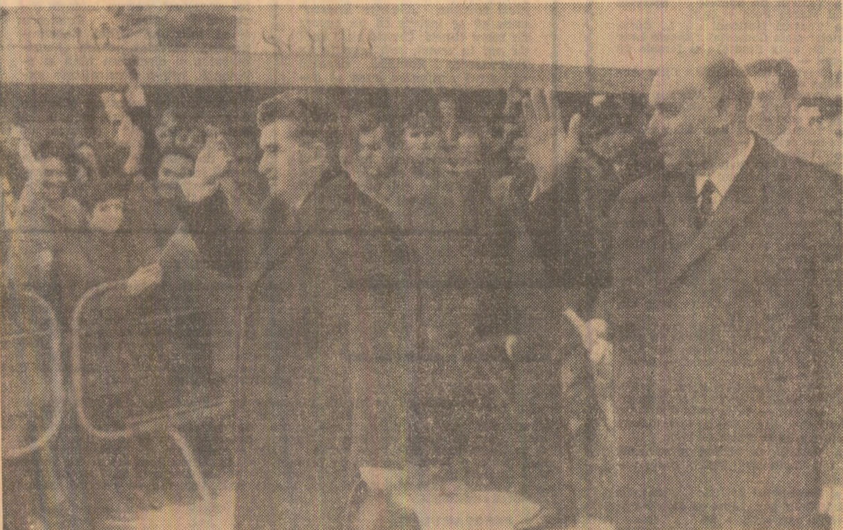
Tovarășul Nicolae Ceaușescu, împreună cu tovarășul Todor Jivkov, răspund aclamațiilor cetățenilor veniți în întîmpinare pe aeroportul din Sofia