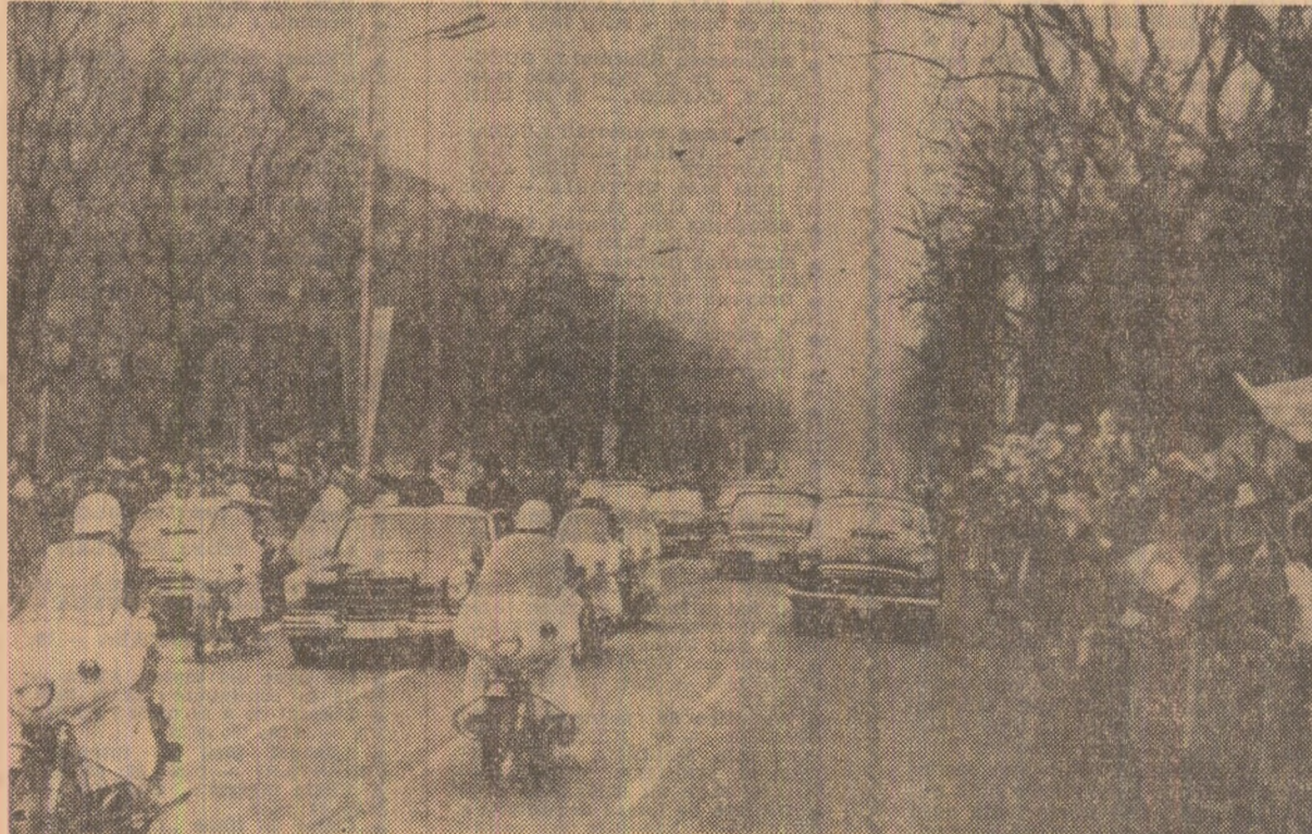
Locuitorii capitalei Bulgariei socialiste fac o primire entuziastă delegației de partid și guvernamentale a României