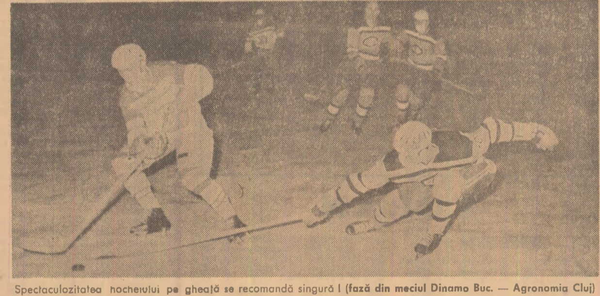
Spektacolozitatea hocheiului pe gheață se recomandă singură! (fază din meciul Dinamo Buc. — Agronomia Cluj)

ARMONIE • CARNET MUZICAL • ELOGIU • PORTULUI POPULAR • ECRAN • SCENA