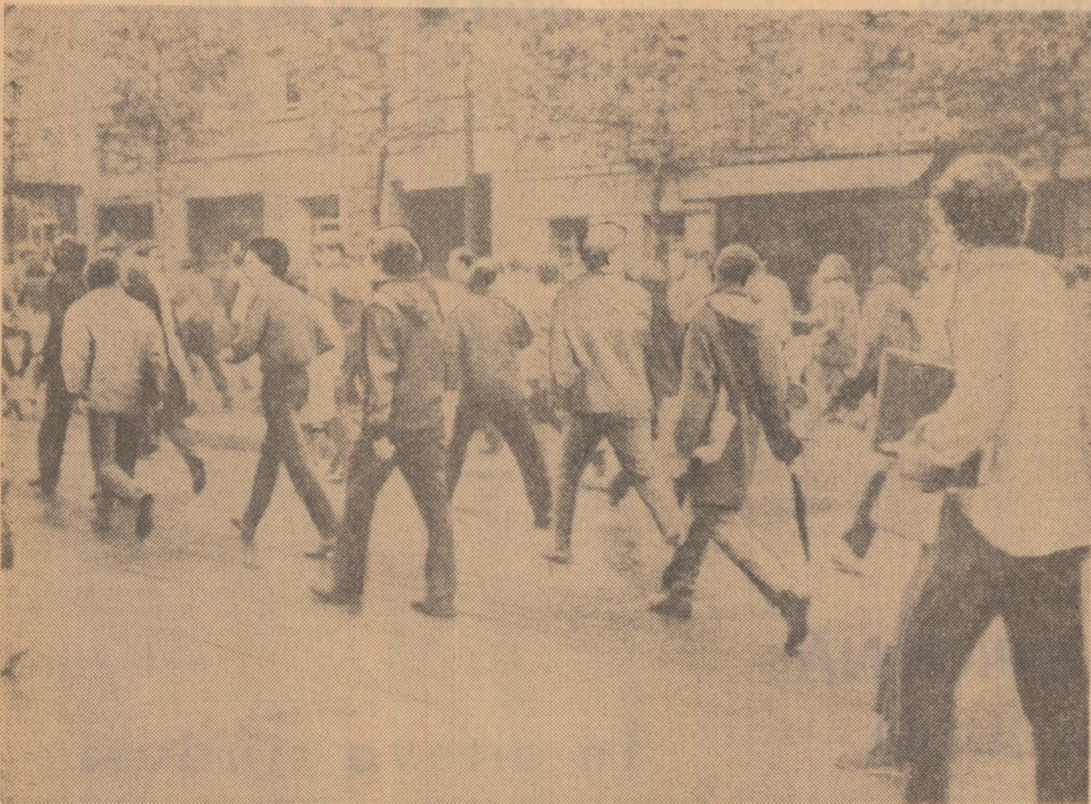
Studentii spanioli demonstrând pe străzile Madridului în semn de solidaritate cu militanții basci