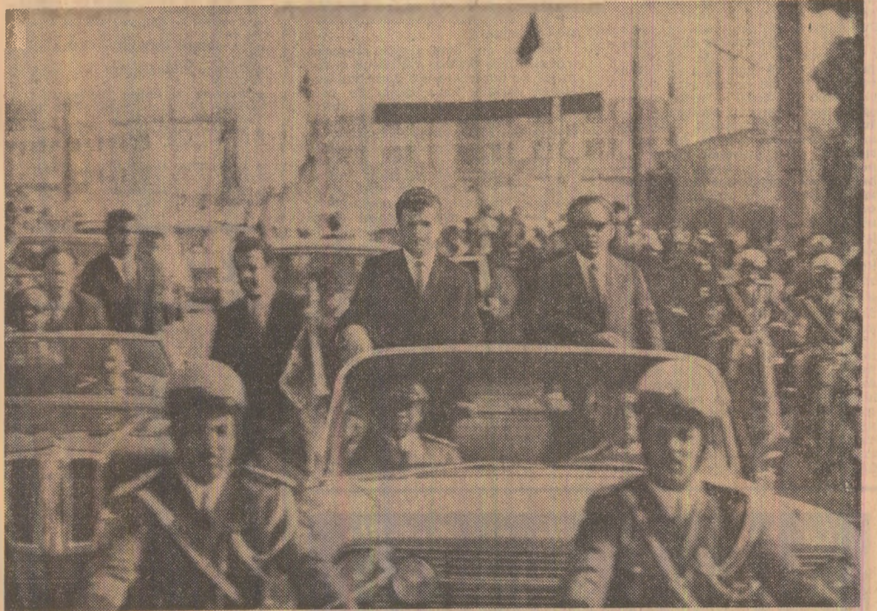
Pe străzile Rabatului, populația salută cu cordialitate pe șeful statului român