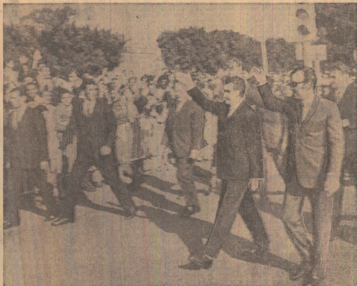
Președintele, în vizita prin capitala Marocului, președintele Nicolae Ceaușescu este întâmpinat cu aplauze și glameuri.