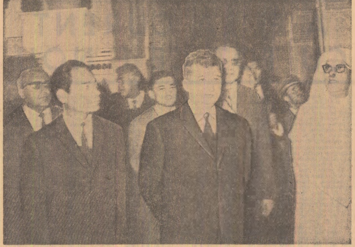
La mausoleul Mohammed al V-lea