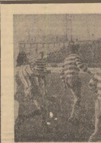
Secvență din cel mai disputat meci al ultimei etape, Rapid—Farul. Șase bucureșteni (tricouri vîrgate orizontale) asaltează poarta constanțeană