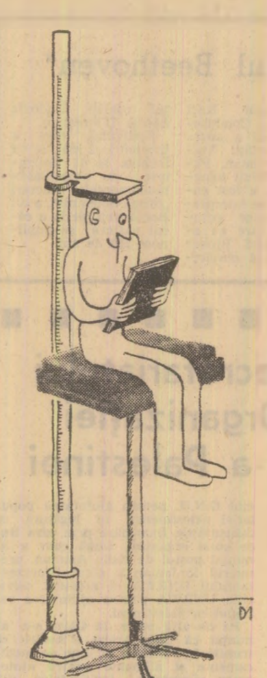
Desen de: I. Dogar Marinescu

oale mai simple probe fizice de alertare, săritură și aruncare. Comparând aceste rezultate cu cele cunoscute dintr-un studiu efectuat cu 30 de ani în urmă pe 3500 de elevi din diferite orașe ale țării noastre, am constatat că, într-adevăr, rezultatele actuale sunt superioare în valoare absolută, dar, dacă le raportăm la indicii somato-funcționali respectivi, ele sînt numai cu puțin mai mari la probele de alertare și aruncare (care sînt influențate probabil mai mult de creșterea înălțimii și greutatei corporale) dar au rămas în urmă la probele de săritură, care depinde îndeosebi de dezvoltarea funcțiilor neuromotrice. Care ar fi cauzele acestor neconcordanțe? Există părerea că factorii de accelerare a creșterii și dezvoltării corporale nu stimulează în aceeași măsură dezvoltarea funcțiilor motrice, pentru că acționează asupra organismului mai mult în mod static, iar influențele lor sînt mai puțin pasive.