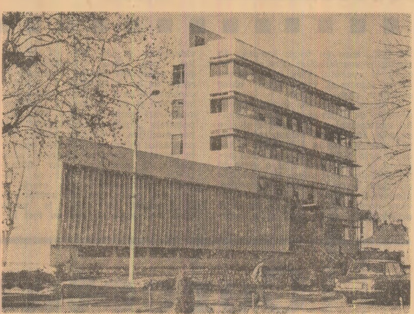
Clădirea noului centru de calcul teritorial din Timișoara