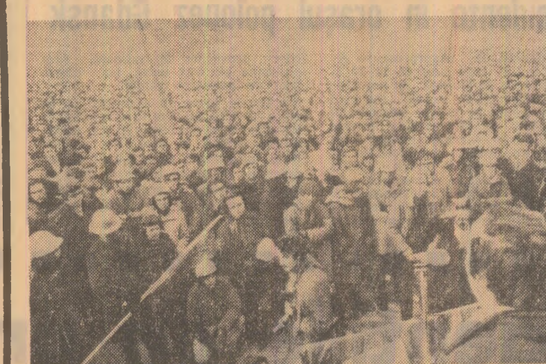
Tineretul din Milano demonstrează împotriva recențelor acțiuni ale elementelor neoaziste