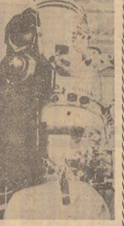
Stația automată interplanetară „Venus-7” în camera de probă

Politia braziliană continuă să rămînd în alertă. Miercuri, într-un bar din Copacabana, a fost descoperit un nou mesaj al răpitorilor diplomaților elvețieni Bucher, prin care aceștia cer guvernului să-și asume un angajament oficial de a elibera, în schimb, ostaticul deținut, 70 de prizonieri politici.