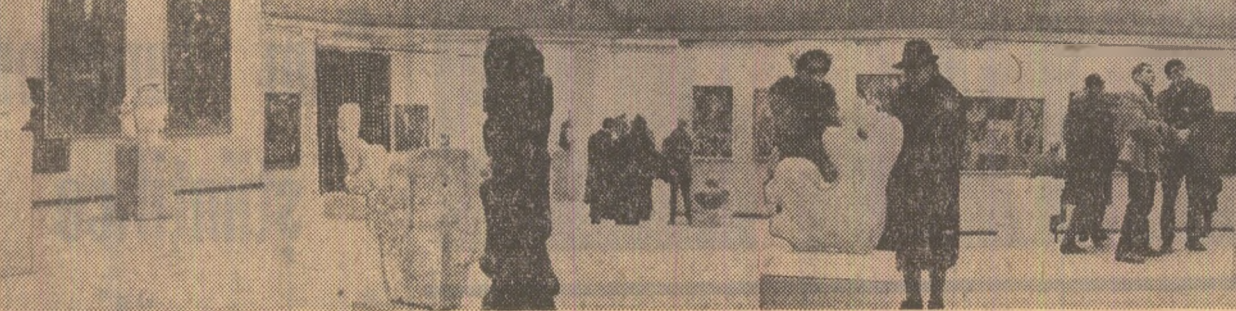
Bienala de artă plastică, deschisă la sala Dulles, înmănușchează cîteva sute de lucrări de pictură și sculptură, semnate de artiști din diferite generații.

PRODUȚII ALE STUDIOURILOR DIN ALTE ȚĂRI: Buzeski; Metode; R. P. Ungară; Drumul Sării. Ospetii din Valea