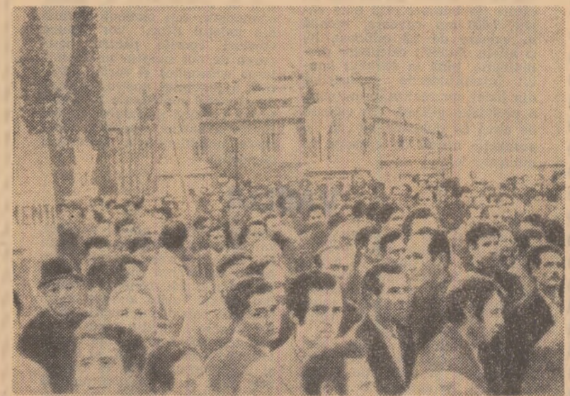
Italia. Demonstrație a muncitorilor din construcții în piața Campidoglio din Roma pentru reforme sociale și încheierea unor noi contracte de muncă

KUWEIT 26 (Agerpres). — În capitala Kuweitului a început sîmbătă cea de-a 6-a conferință a Organizației statelor arabe exportatoare de petrol (O.A.P.E.C.) consacrată examinării unor proiecte și propuneri de dezvoltare a cooperării interarabe. Acestea prevăd, între altele, crearea unei flote arabe de tancuri petroliere, deschiderea unui mare șantier naval în Golful Persic și realizarea unei instituții financiare arabe. Participanții vor lua în discuție, de asemenea, bugetul organizației pentru anul viitor.