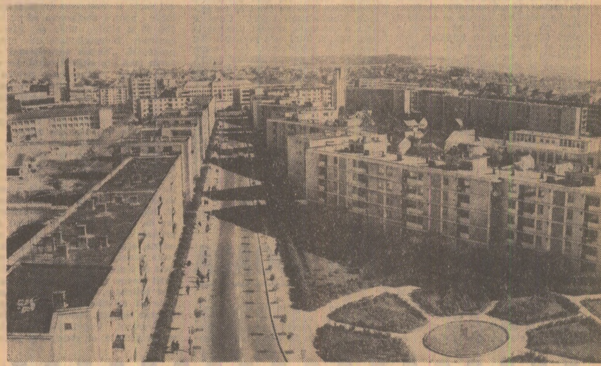
Vedere panoramică din orașul Baia Mare