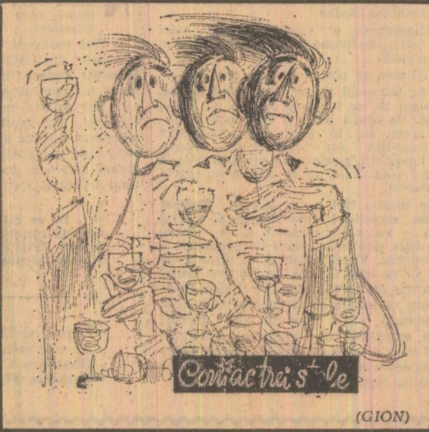
Contac trei s'le (GION)