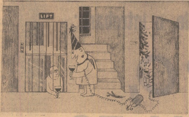
— Ce noroc ai avut că s-a blocat liftul între etaje! Înăuntru e o plicifisedlăă!