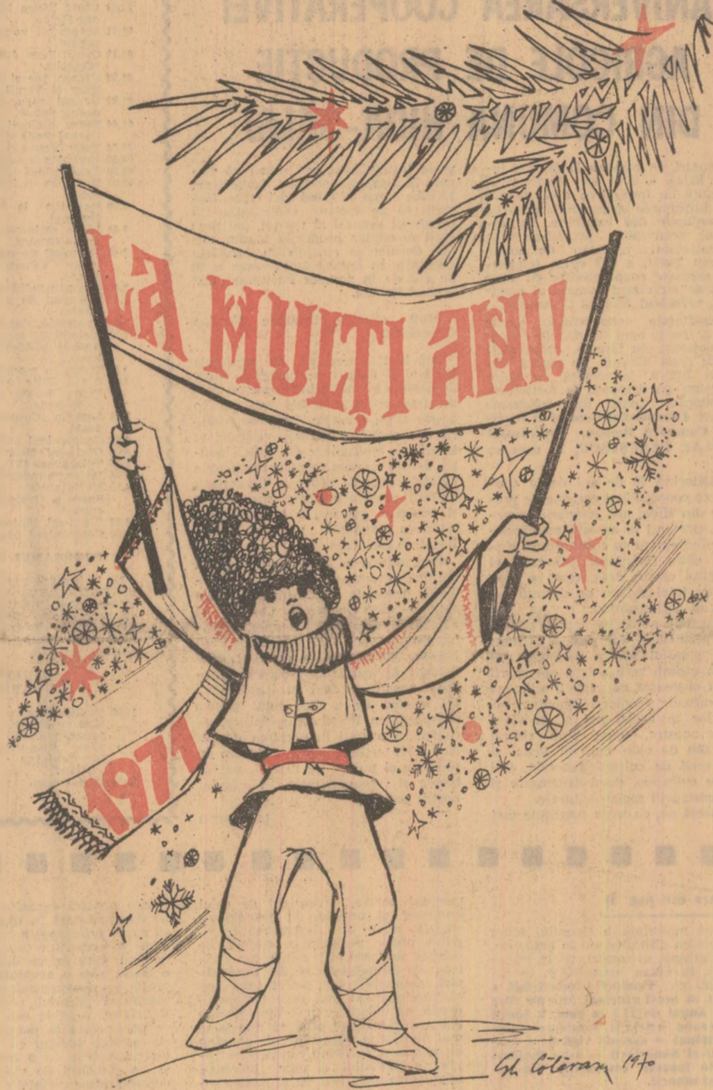
(Desen de Gh. CALĂRAȘU)

E o urare adresată nu numai celor ce mină tractoare puternice, pluguri cu cinci brăzdare, ci tuturor celor ce mînuiesc milioanele de motoare și unelte ale țării, celor ce, cu brațul și cu mintea, făuresc viitorul de aur al României socialiste. E o urare care nu are sfîrșit — intrucît poporul nu cunoaște bătrînețea: „La anul” și la mulți ani!”