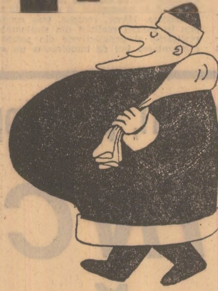
Egoistul. (I. Dogar MARINESCU)