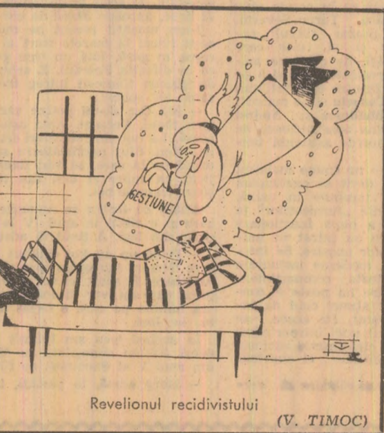
Revelionul recidivistului (V. TIMOC)