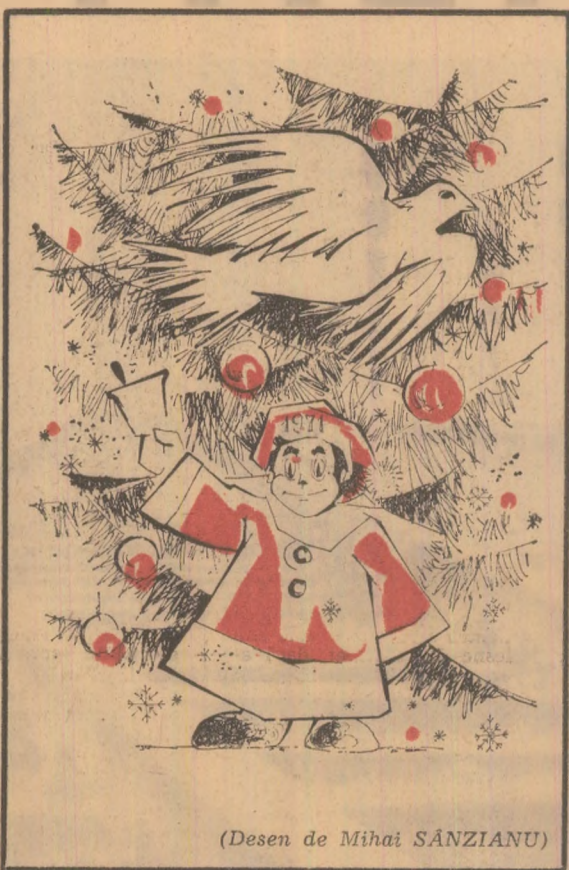
(Desen de Mihai SANZIANU)

La ducere, nu m-ar deranja, la întoarcere însă foarte mult. Dacă o confund cu Calea Laptelui? Cum o mai înțuc, fără limită de pantofi? Nu știu, și nici nu conțeză. Principalul e că au fost inventați specialiștii de la Vinalcool. — O seîniță de analiză a muncii! — Din prefabricate de beton. (Dacă-ai ști pe cine am ca invitați, m-ați înțetege!) Mai mulți. Unul din jurul Ploieștului, care-și fura singur gănilile, și pe urmă-și dădea în judecată vecinii. Un pensionar dintr-o comună din județul Bacău. Nu-ți vîndea o cutie de cremă de ghețe neagră pînă nu cumpărai și două maro. Cartea de muncă a unui fotbalist din divizia B. În trei ani trecuse prin 14 întreprinderi și lucrase ca: ofelar, zugrav, ceaprazar, oficiar sanitar, merceolog, coșar-șef, laborant, scafan-dru, tinichigiu, apod, bucătar dietetic, tapijer... — Un poem romantic, dintr-o plachetă de versuri. O găsiți în orice librărie. Reproduc din memorie: 1, 2, 3, 4, 5, 6, 7 (fabulă) 16855801 31433413 69554683 99999999 24563916 10345956 Morale: 7654321