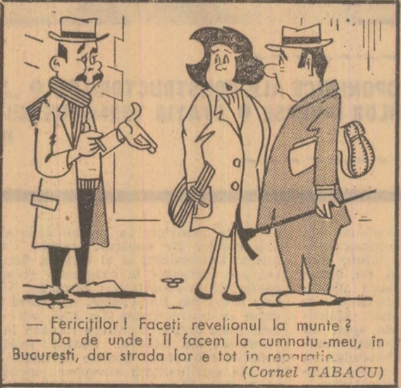
— Fericiților! Faceți revelionul la munte? — Da de unde! Il facem la cumnatu-meu, în București, dar strada lor e tot în reparatie. (Cornel TABACU)

Pentru că am reîntinut-o în întregime, jără eforturi intelectuale și, în afară de asta, merge și cîntă la nai. „Gospodine, dați copitilor bomboane!” și „Cădourii utile!”.