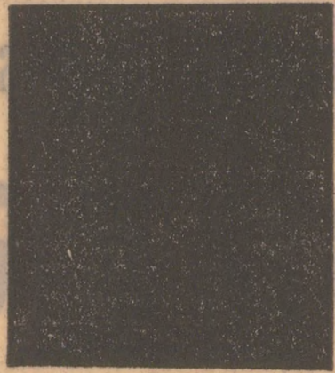
— Du-te, dragă, și plătește lumina, s-avem și noi ce stinge la miezul nopții!