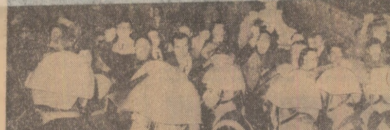
Demonstrație la Roma împotriva sentinței pronunțate la Burgos

PARIS. — 15.000 de persoane au participat în capitala Franței la un marș de protest împotriva sentințelor de la Burgos. La Brest, în vestul Franței, numeroși locuitori au manifestat în semn de protest față de condamnarea militanților basci și au adresat generalului Franco o telegramă în care, după ce denunță „aparocia de Justiție de la Burgos”, cer anularea sentințelor de condamnare la moarte.