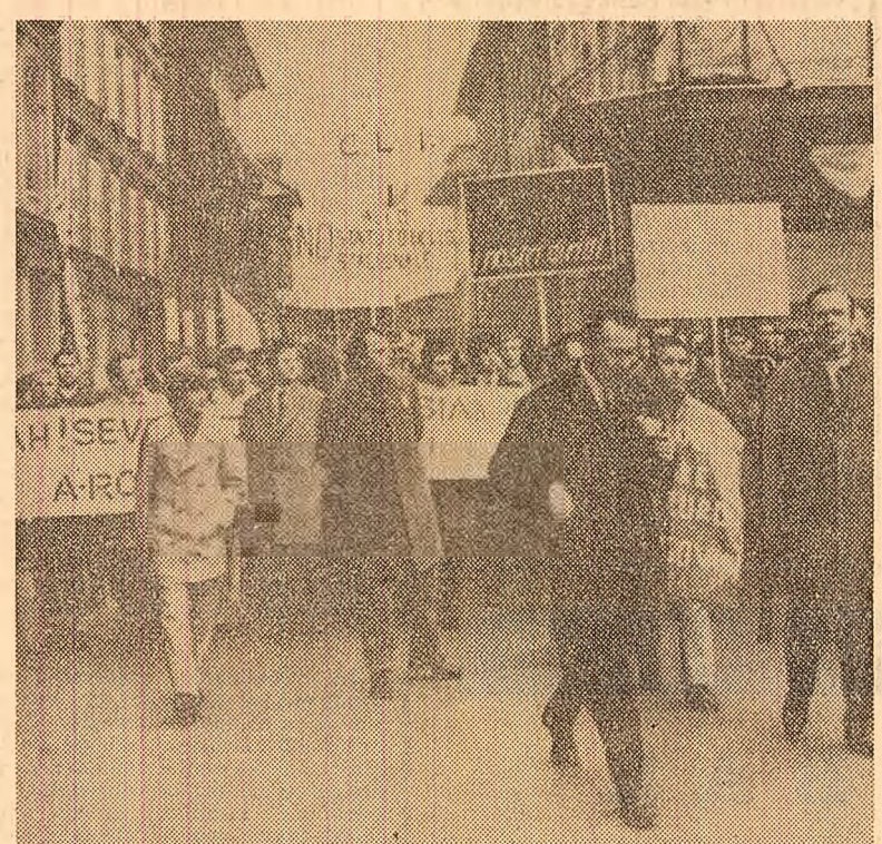
Zirich. Demonstrație organizată de muncitori străini care lucrează în Elveția pentru îmbunătățirea condițiilor lor de muncă