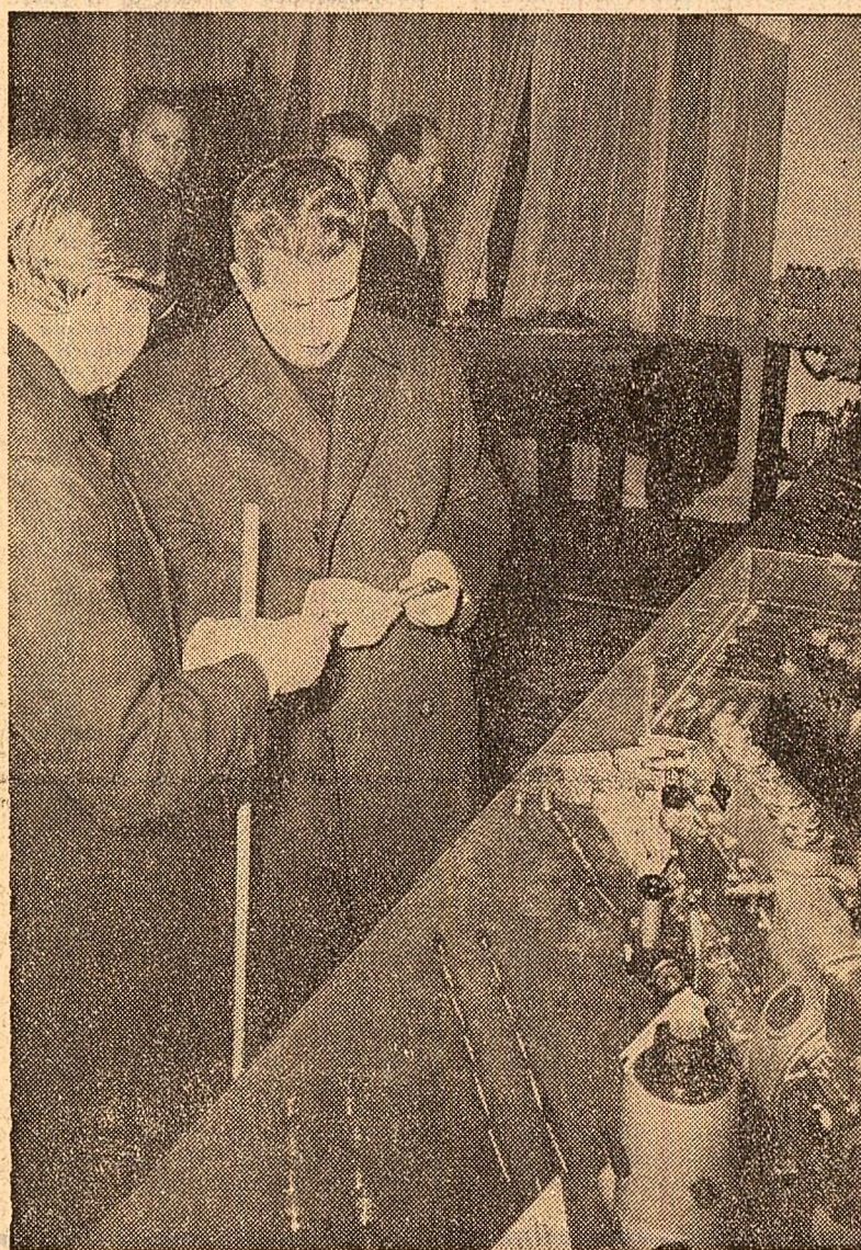
La Uzina de mecanică fină din Sinaia sînt prezentate tovarășului Nicolae Ceaușescu principalele produse ale întreprinderii

Se vizitează mai tîrziu hala de automate și semifabricate pentru aparatură de precizie. Secretarul general al partidului se interesează de desfășurarea procesului de pro-