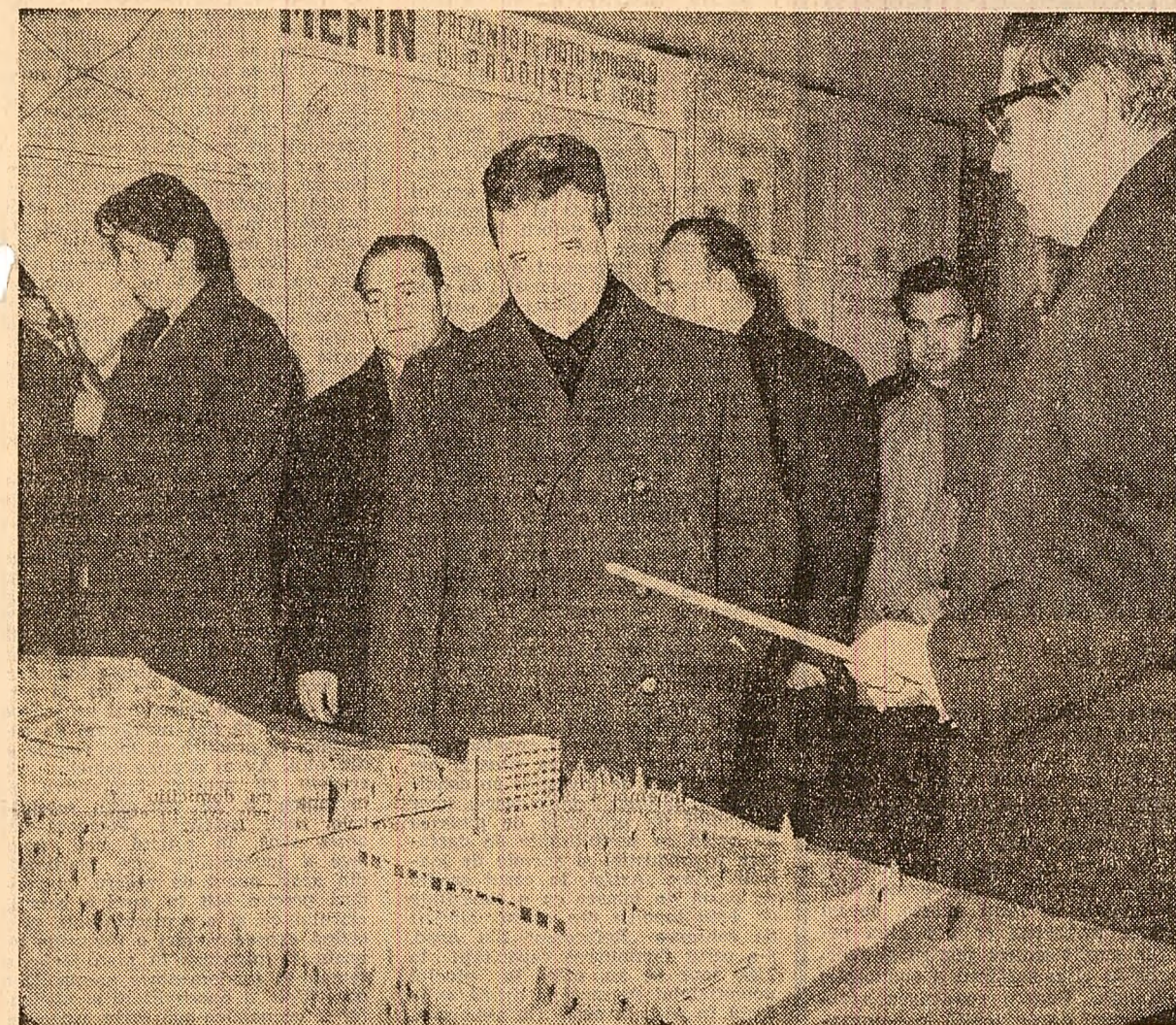
În fața machetei care înfățișează dezvoltarea viitoare a Uzinei de mecanică fină din Sîncioi

acestea, a posibilităților de exportare a produselor uzinei din Sîncioi, produse apreciate unanim de parteneri.