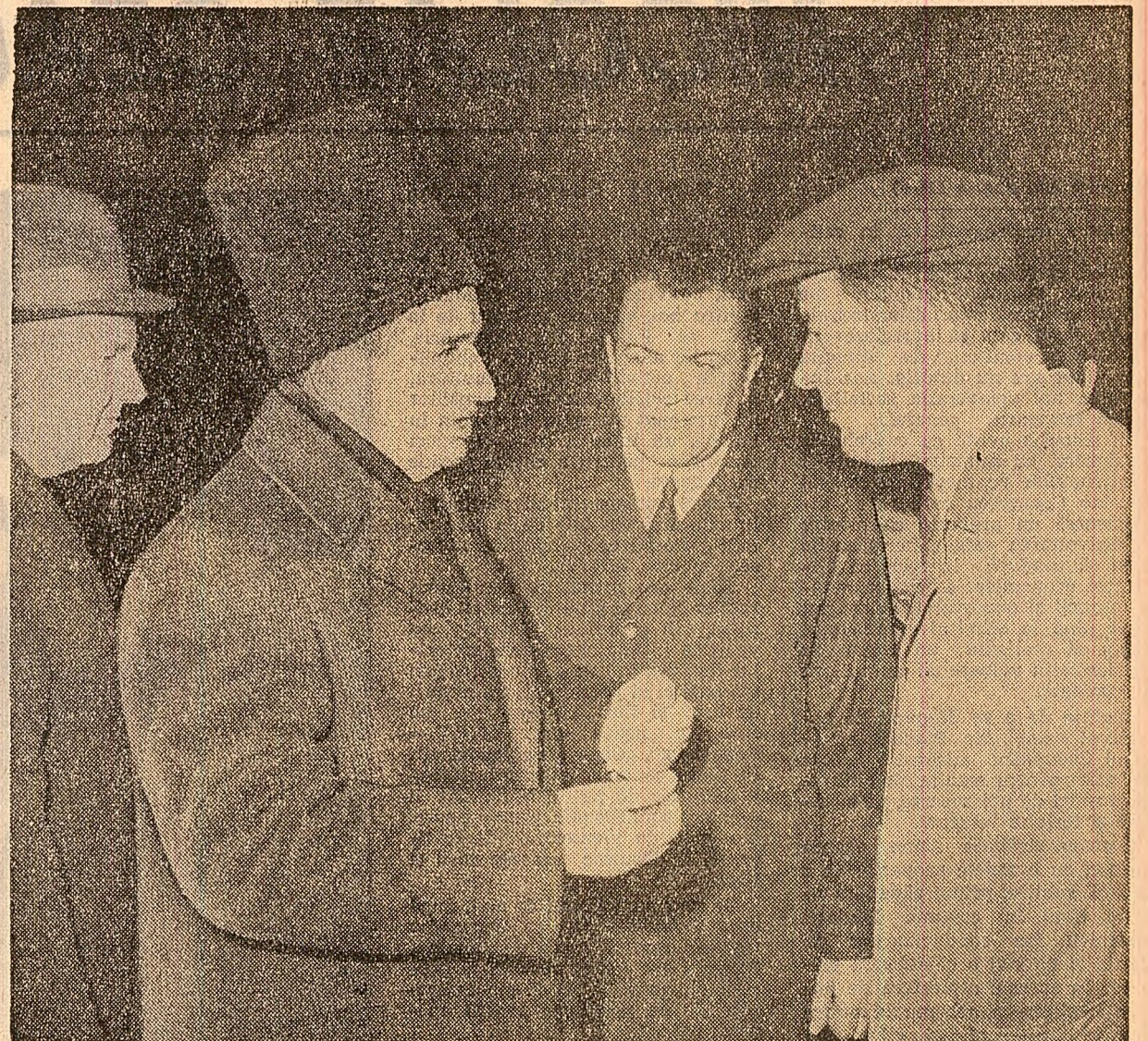
Cuvintele tovarășului Nicolae Ceaușescu, indicațiile sale sint primite cu deosebit interes