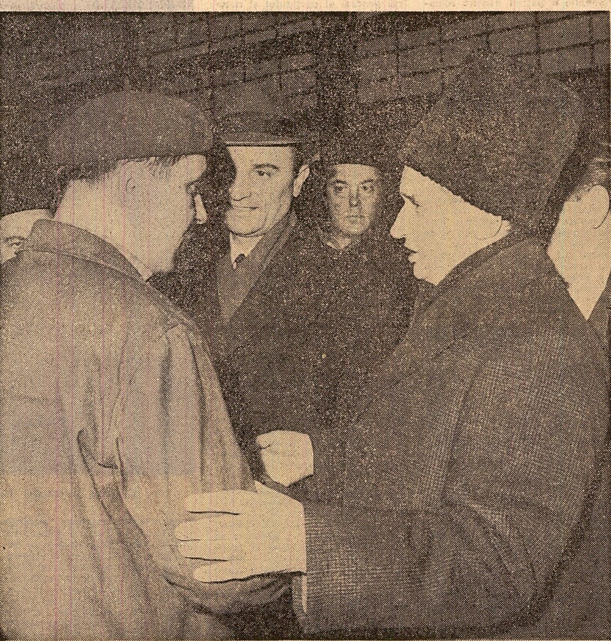
În mijlocul celor ce muncesc în renumita uzină ploieșteană „1 Mai”