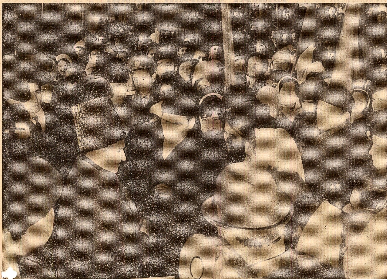
Și la Cîmpina, ca pe tot parcursul vizitei, oamenii muncii l-au întâmpinat cu entuziasm și căldură pe secretarul general al partidului, vorbindu-i despre munca și realizările lor

ION GHEORGHE MAURER Președintele Consiliului de Miniștri al Republicii Socialiste România