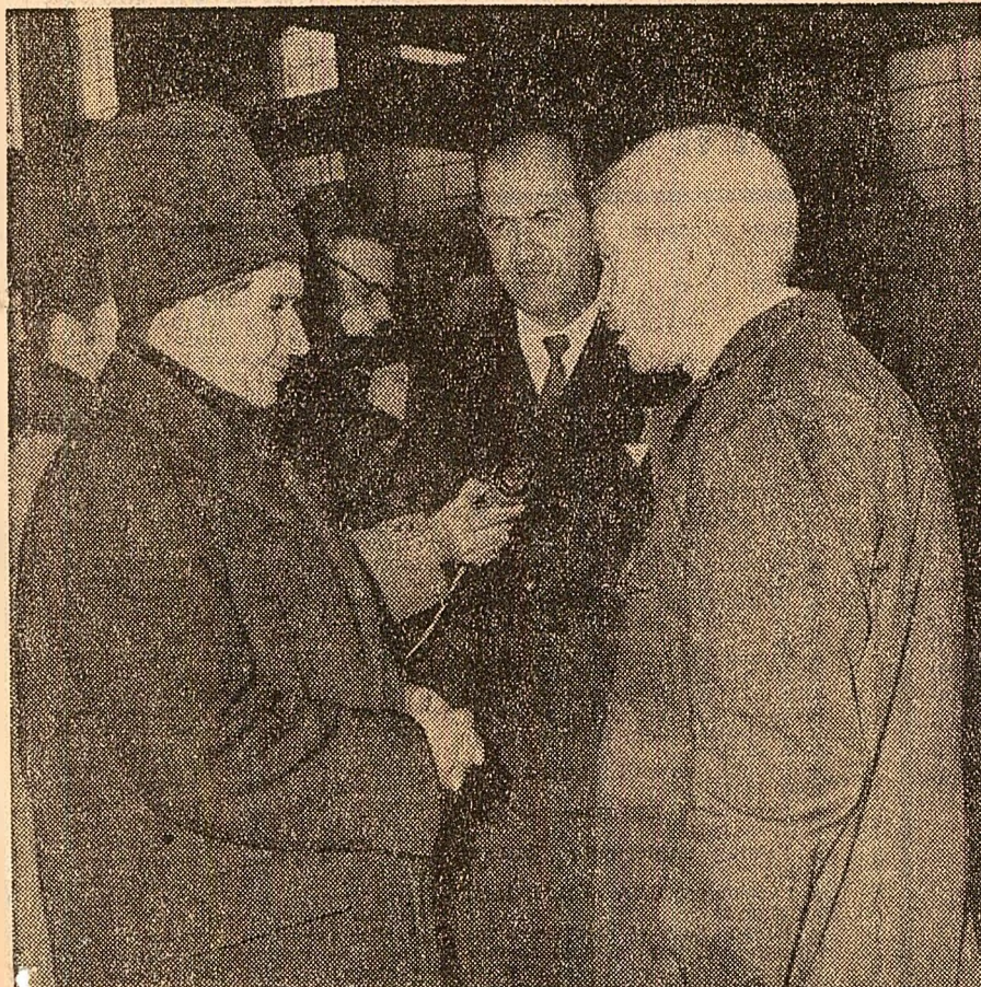
Prelutindeni, în toate uzinele vizitate, secretarul general al partidului discută cu muncitorii, tehnicienii și inginerii despre condițiile lor de muncă și viață, despre problemele concrete ale producției

— E bine spus uzina noastră, (Continuare în pag. 4 IV-a)