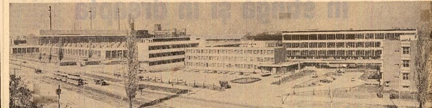
În ultimii ani, industria Capitalei — care realizează circa o cincime din întreaga producție industrială a țării — s-a adăugat noi capacități de producție, dotate cu utilaje moderne, de mare randament. În imagine: noua zonă industrială — Dudașii.