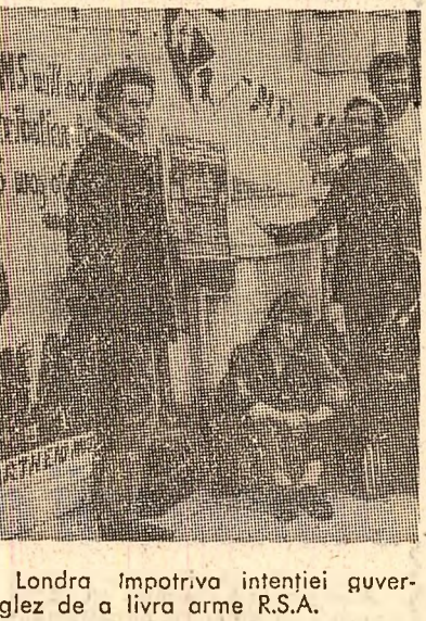
Demonstrație la Londra împotriva intenției guvernului englez de a livra arme R.S.A.

Încă 44.000 de britanici au semnat declarația de protest împotriva intenției cabinetului conservator de a relua livrările de armament către regimul de la Pretoria. În foful acesta, 94.000 de cetățeni din Marea Britanie și-au declarat dezaprobar față de aceste planuri ale guvernului Heath, condamnate de altele de majoritatea liderilor țării și africane. Declarația a fost trimisă pe adresa conferinței Commonwealthului de la Singapore.