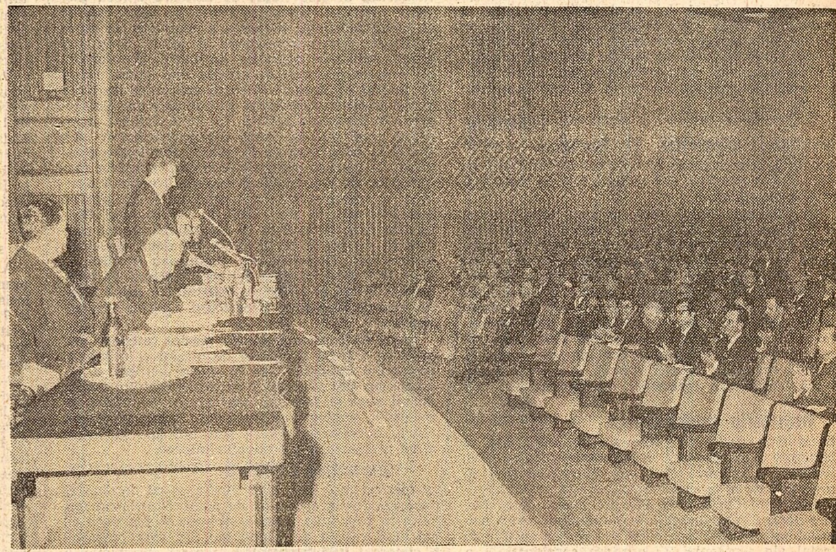
În timpul lucrărilor plenarei

În încheierea lucrărilor plenarei a vorbit tovarășul NICOLAE CEAUȘESCU.