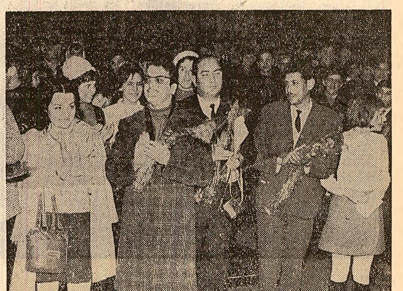
Imaginea de la mitingul de solidaritate cu lupta popoarelor și tineretului țărilor arabe care a avut loc miercuri la Brașov