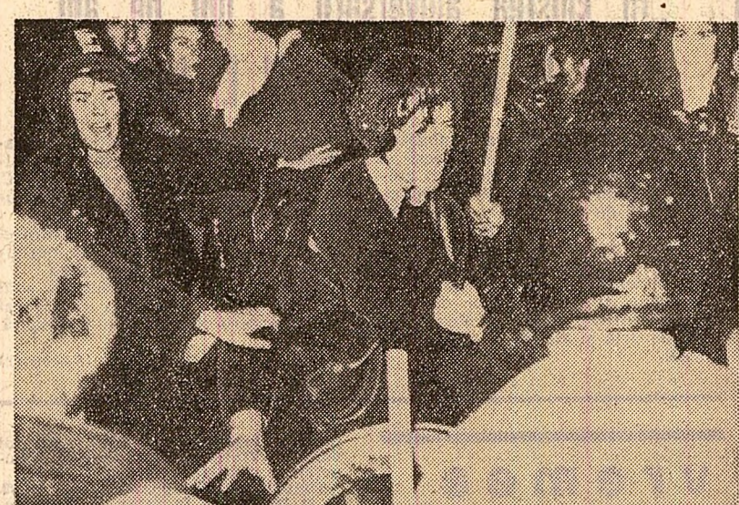
Mi de tineri francezi au manifestat, pe străzile Parisului, împotriva intențiilor organizației de extremă dreapta, „Ordinea nouă”, de a prezenta candidații la apărutele alegeri municipale. Exprimându-și indignarea, manifestații s-au îndreptat spre „Palatul sporturilor” din capitală, unde se desfășurau reuniunile acestei organizații, scandând „Fascismul nu va trece”.