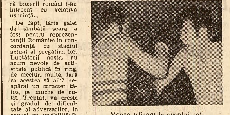
Monea (stînga) în avantaaj nel...

Mal înțit, citeva cuvinte despre pugiliștii din țara noastră. Pei înfrînți, aproape fără excepție - însăși excepția datorîndu-se unui accident și nu superiorității de punctaj - pugiliștii danezi au arătat citeva calități demne de relevat. Ei sînt posesorii unor cutii de luptă tehnice bune, au curaj în luptă și se comportă foarte sportiv pe ring, iar din punct de vedere al trăsăturilor naturale sînt corespunzător înzestrați (înălțime în concordanță cu cerințele moderne ale fiecărei categorii, alonjă etc.). Probabil, datorită însușirilor pregătirii fizice, calității remarcabile a se valorifica, danezii n-au forțat în luptă și nici rezistența necesară pentru cele trei rînduri. Așa se face că boxerii români l-au întrecut cu relativă ușurință. De fapt, țaria galei de sîmbătă seara a fost pentru reprezentanții României în concordanță cu stadiul actual al pregătirii lor. Luptătorii noștri au acum nevoie de activitate publică în ring de meciuri multe, fără ca acestea să aibă neapărat caracter de meciuri de energie. Ca și Cutov, apărare proastă, în plus, atacă meciurile fără minimă prudență, fiind victima sigură a unui pugilist care stă la contrez; Iliescu - termină e-