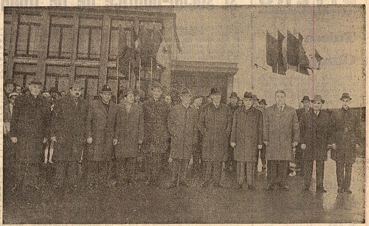
La plecare, pe aeroportul Băneasa

Luni la amiază a părăsit Capitala, plecînd la Moscova, delegația Partidului Communist Român, condusă de tovarășul Nicolae Ceaușescu, secretar general al Partidului Communist Român, care va participa la lucrările celui de-al XXIV-lea Congres al Partidului Communist al Uniunii Sovietice.