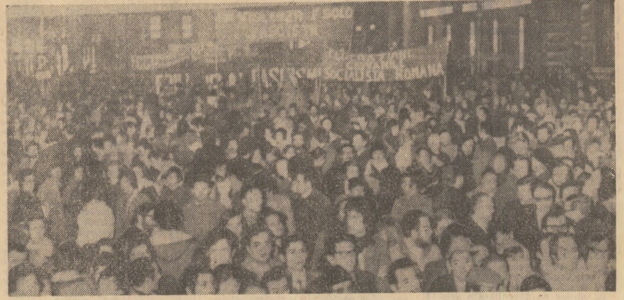
Roma. Mii de oameni în timpul unei recente manifestații de protest împotriva provocărilor elementelor neofasciste italiene.

TRIPOLI 3 (Agerpres). — După îndelungi și dificile tratative, vineri seara a fost semnat la Tripoli un acord între Libia și companiile petroliere occidentale care operează pe teritoriul libian, a anunțat Abdeslam Jallud, vice-prim-ministru al Libiei. Acordul a fost încheiat pe o perioadă de 5 ani și prevede majorarea „prețului afișat” al petrolului libian de la 2,55 dolari per baril la 3,45 dolari. Companiile petroliere au acceptat, de asemenea, ca impozitul asupra beneficiilor realizate să fie marit de la 50 la sută la 55 la sută. Pe de altă parte, potrivit comunicatului, administrația companiilor s-a angajat să continue cercetarea și lucrările de prospecțiune petroliere și va efectua investiții în Libia din beneficiile realizate prin exploatarea țițeiului. Prevederile acordului intră în vigoare începînd de la 20 martie 1971.