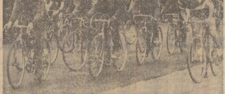
Ciclism pe aleile dintre blocurile cartierului Titan (Start în „Circuitul Voină”)

Ale șirii și rezultate sportive în pagina a III-a a ziarului