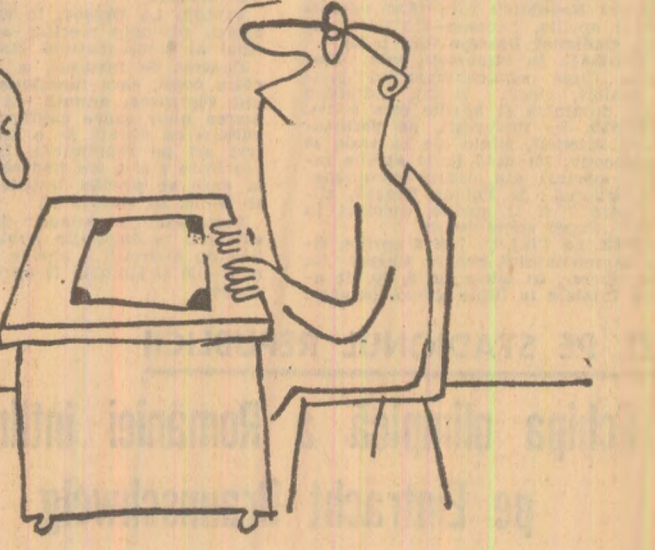
(Desen de I. Dogar Marinescu)