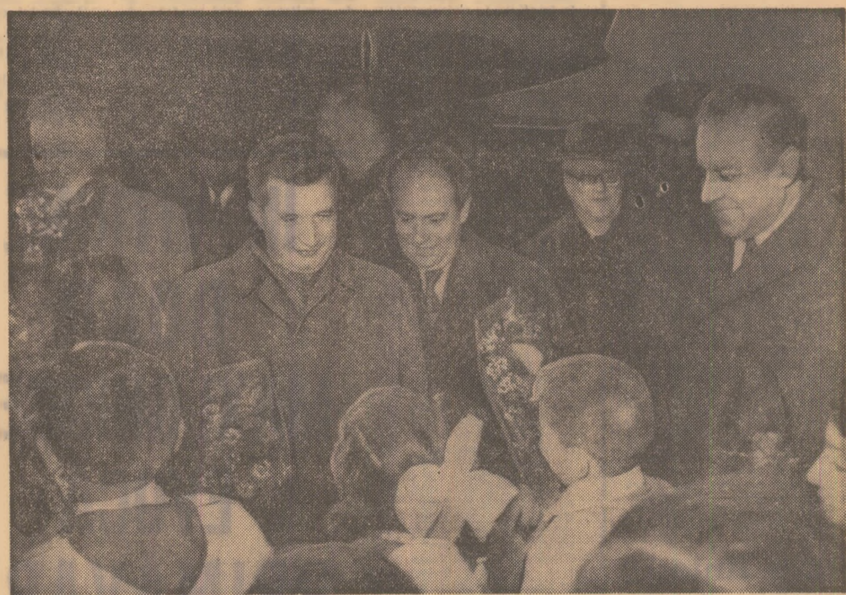
La sosire, pe aeroportul din Baku