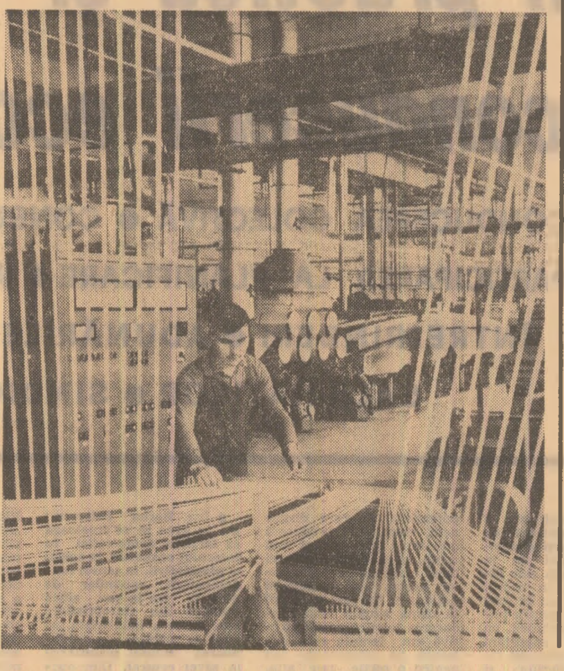
Îngrășăminte azotoase din Slobozia?

Manoile CORCACI correspondentul „Scintei”