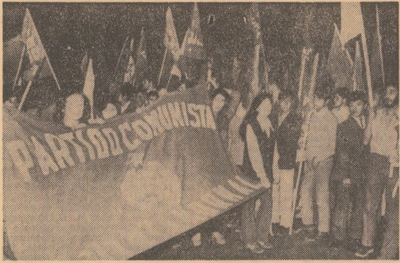
Miting la Santiago de Chile exprimând entuziasmul maselor muncitoare determinat de victoria Frontului Unității Populare în alegerile care au avut loc duminică.