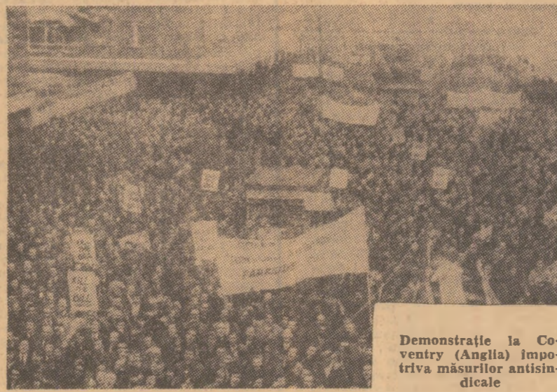
Demonstrație la Coventry (Anglia) împotriva măsurilor antisociale

peste hotare, participante la Congresul al XXIV-lea al P.C.U.S. La recepție au luat parte și delegația Partidului Comunist Român, condusă de tovarășii Nicolae Ceaușescu, care a participat la lucrările Congresului al XXIV-lea al P.C.U.S.