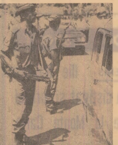
Patrule ale trupelor guvernamentale controlează autovehiculele pe una din șoselele de acces spre Colombo

Comunicatul relevă că aviația a mitraliat punctele de rezistență de la Kogama și Waga, situate în centrul țării, la 70 kilometri de Colombo. Forțele terestre guvernamentale, soșite ulterior la fața locului, au confiscat o mare cantitate de arme, precum și materiale utilizate pentru fabricarea bombelor.