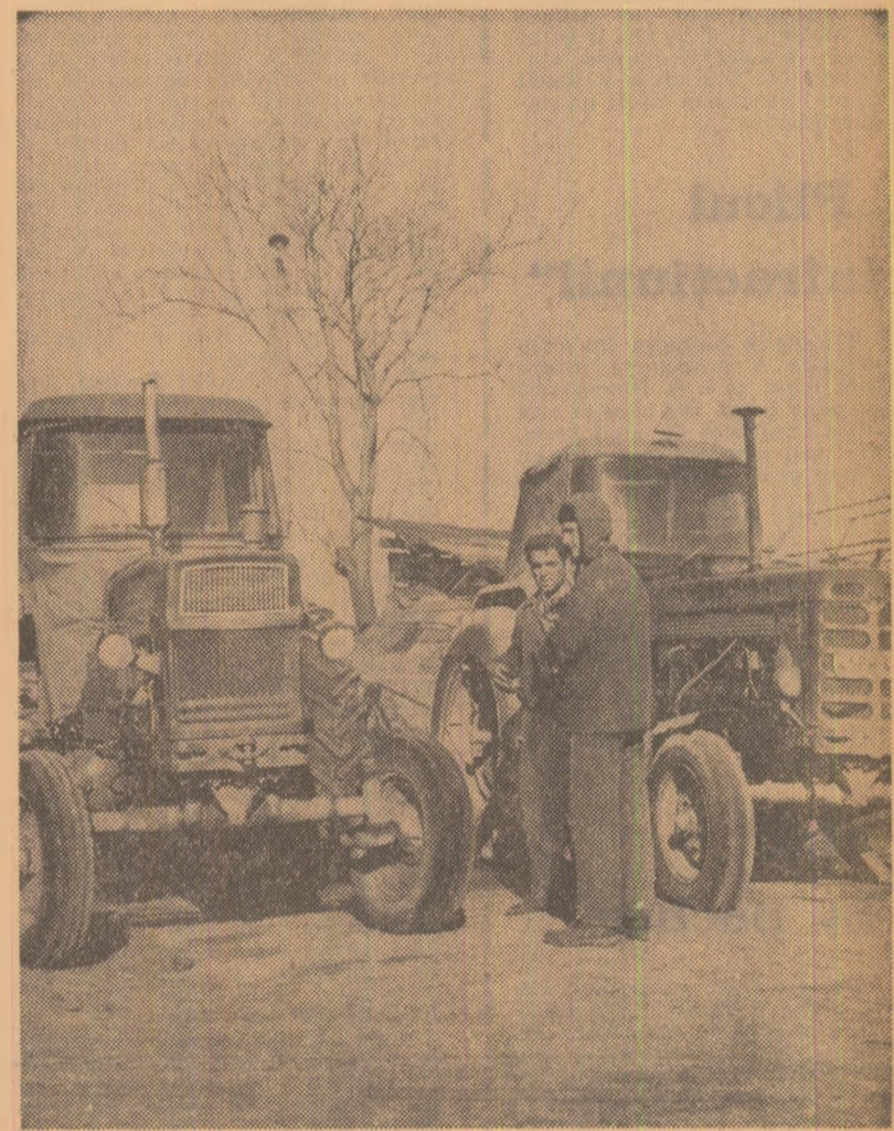
Tractoriștii de la C.A.P. Tătărăni, județul Prahova, sînt în așteptare... De ce? La ora 9, inginerul șef al cooperativei nu ajunsese încă la secția de mecanizare