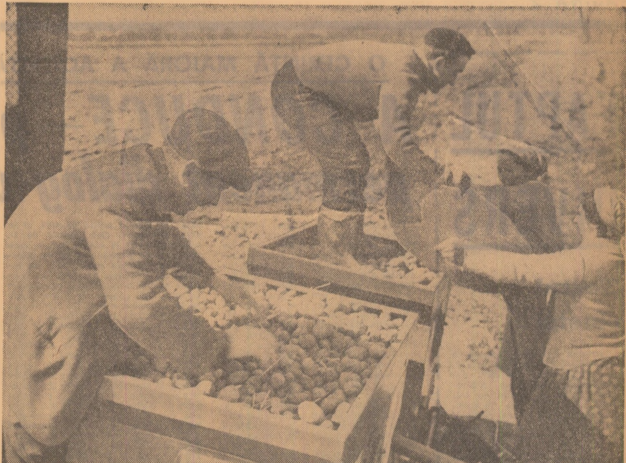
Dis-de-dimineață, cooperatorii din Dărmănești, județul Dimbovița, au început plantarea mecanizată a cartofilor timpurii

rale agricole, săptămîna aceasta va începe semănatul porumbului. Dar în multe unități, printre care cele din Cornești, Colajca, Răcari, Fînta și altele, nu s-a terminat încă de semănat floarea-soarelui. Sîmbătă, deși timpul era frumos, în unele cooperative agricole nu s-a lucrat la semănatul florii-soarelui. În curtea secției de mecanizare, care deservete cooperativa agricolă din Bîlculești, erau alinate 14 tractoare. Se terminaseră de semănat culturile din prima epocă? Nicidecum. Mai erau de semănat și floarea-soarelui și borceașul. Tractoriștii își făceau de lucru prin curte și așteptau să se depisteze unele parcele unde să se poată semăna. Ingerul șef al cooperativei, care trebuia să facă personală această operațiune, era însă plecat de dimineață la Tîrgoviște.