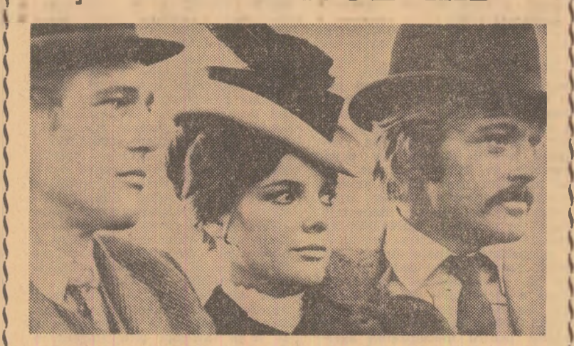
Producție a studiourilor 20-th Century Fox. Regia: George Roy Hill. Cu: PAUL NEWMAN, ROBERT REDFORD, KATHARINE ROSS. Film distins cu premiul OSCAR 1969 pentru scenariu, imagine, cîntec și partitură muzicală.