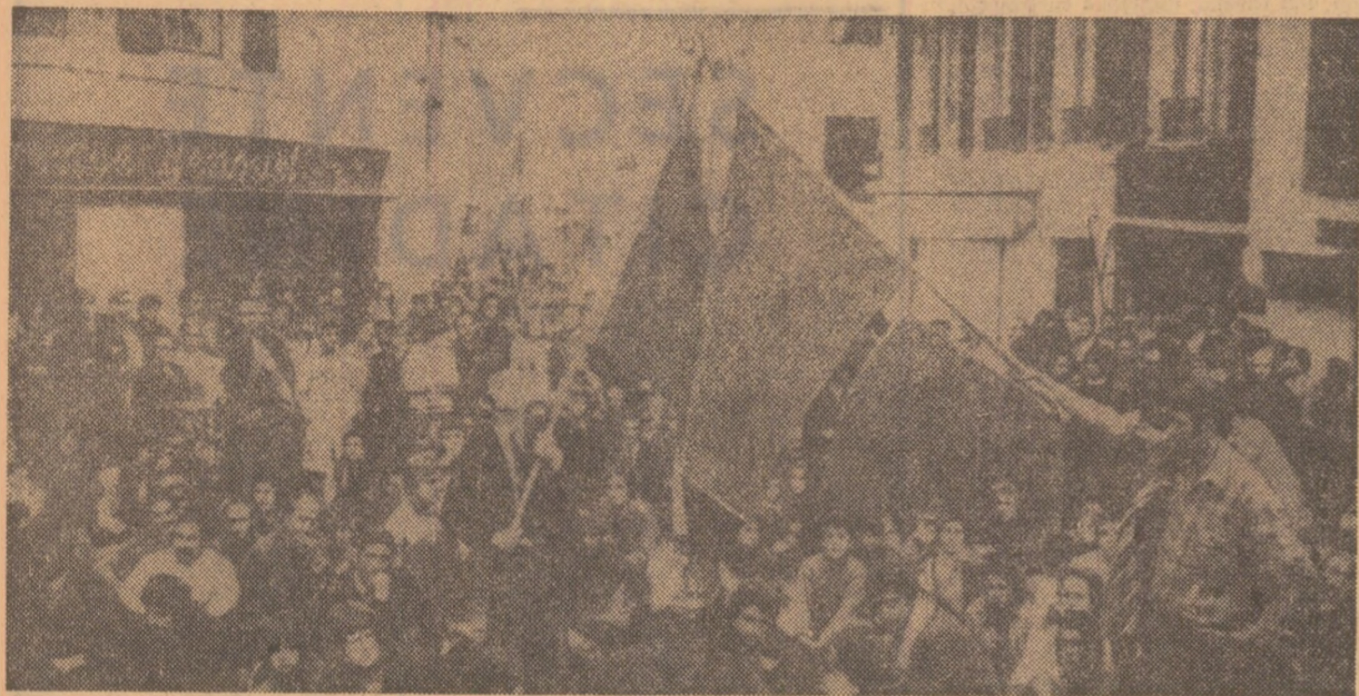
În localitatea Saint-Jean de Luz, de pe coasta atlantică a Franței, s-a sărbătorit „Ziua Bascoil”. Cu acest prilej participanții și-au exprimat solidaritatea cu lupta patrioților spanioli pentru drepturi democratice. Manifestanții au cerut totală și imediată punerea în libertate a deținuților politici, inclusiv a bascoil închiși la Burgos