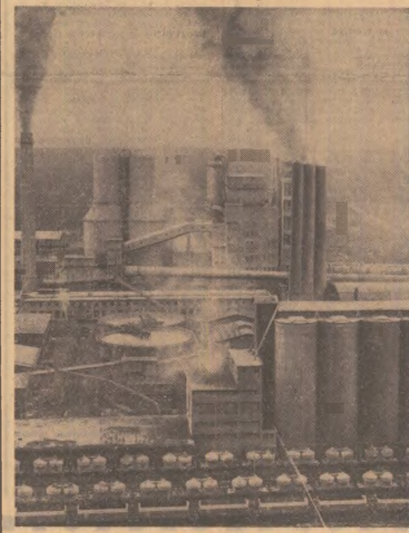
Fabrica de ciment din Medgidia