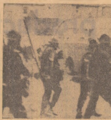
La Londonderry, al doilea oraș ca mărime al Irlandei de nord, au avut loc duminică noi incidente între populație și forțele de ordine — primele de la desarmarea în cursul lunii trecute a noului președinte al Ulsterului, Brian Faulkner. În timpul ciocnirilor, în cursul cărora grupuri de tineri au atăcat trupele britanice cu pietre, iar militarii au ripostat cu gloanțe de cauciuc și gaze lacrimogene, 12 soldați britanici au fost răniți. În fotografie: scenă din timpul incidentelor