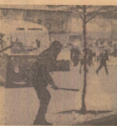
La Londonderry, al doilea oraș ca mărime al Irlandei de nord, au avut loc duminică noi incidente între populație și forțele de ordine — primele de la desarmarea în cursul lunii trecute a noului președinte al Ulsterului, Brian Faulkner. În timpul ciocnirilor, în cursul cărora grupuri de tineri au atăcat trupele britanice cu pietre, iar militarii au ripostat cu gloanțe de cauciuc și gaze lacrimogene, 12 soldați britanici au fost răniți. În fotografie: scenă din timpul incidentelor

LONDRA 13 (Agerpres). — Aproxiativ 90 la sută din cetățenii Marii Britanii se pronunță în favoarea convocării conferinței general-europene pentru securitate și cooperare. Aceasta este concluzia unui sondaj întreprins de comitetele pentru apărarea păcii din Londra, Oxford, Aberdeen și Reding. Sondajul a arătat, de asemenea, că 89 la sută dintre englezi se opun aderării Marii Britanii la Plața comună.