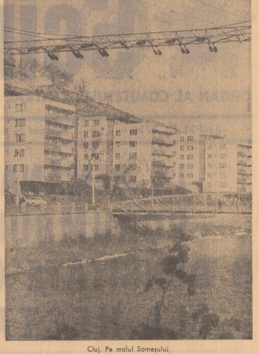
Cluj. Pe malul Someşului

— De ce nu vă simţiţi în această privinţă?