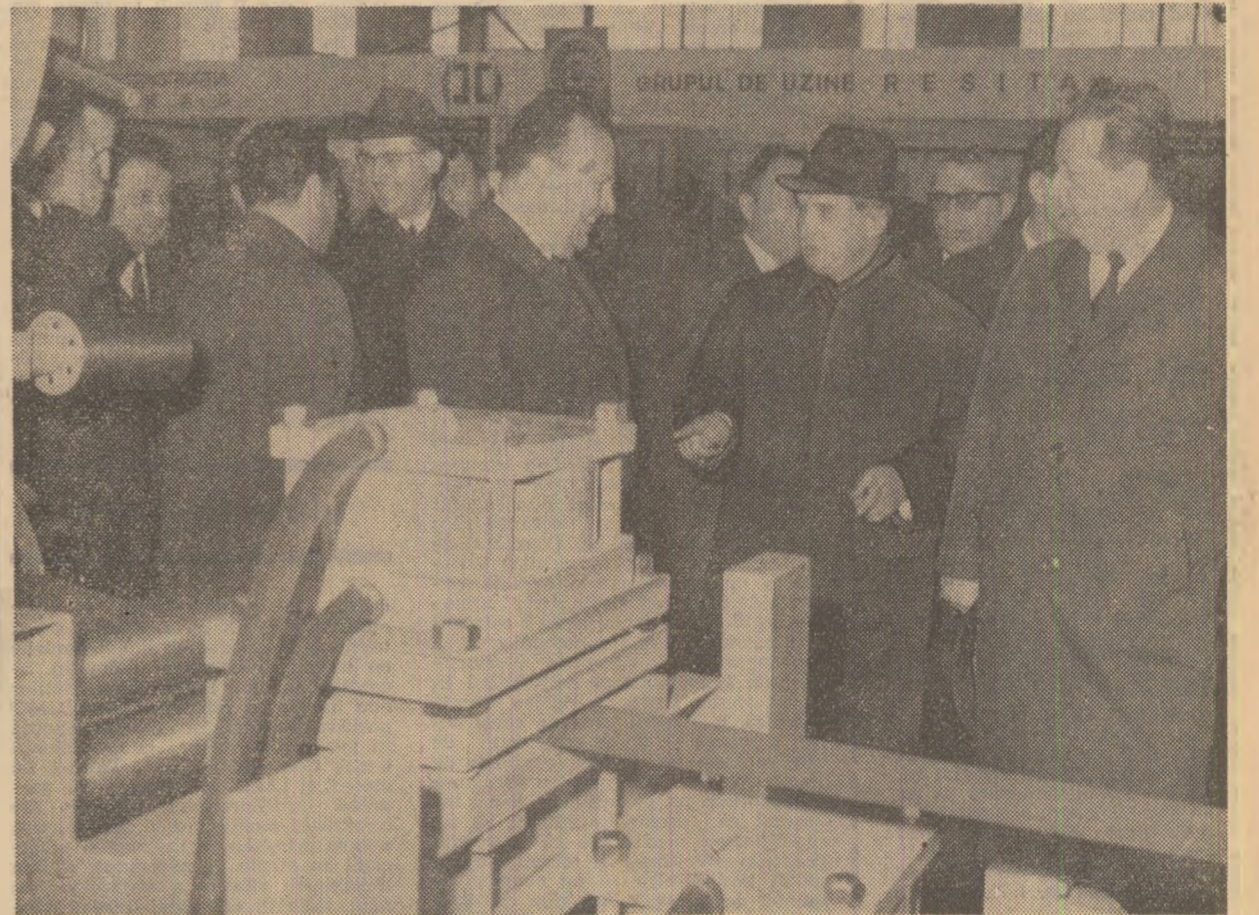
Se vizitează standurile expoziției de mașini și utilaje realizate prin autoutilere

Tovarășul Nicolae Ceaușescu, împreună cu tovarășii Manea Mănescu, Ilie Verdeț și Dumitru Popa, a avut în cursul dimineții de vineri, 16 aprilie, o întâlnire de lucru cu conducătorii ministerelor industriei metalurgice, construcțiilor de mașini, cu directorii și alte cadre de conducere din centrale industriale, unități cu statut de centrală, institute de cercetări și proiectări, cu un mare număr de specialiști din aceste ramuri de producție.