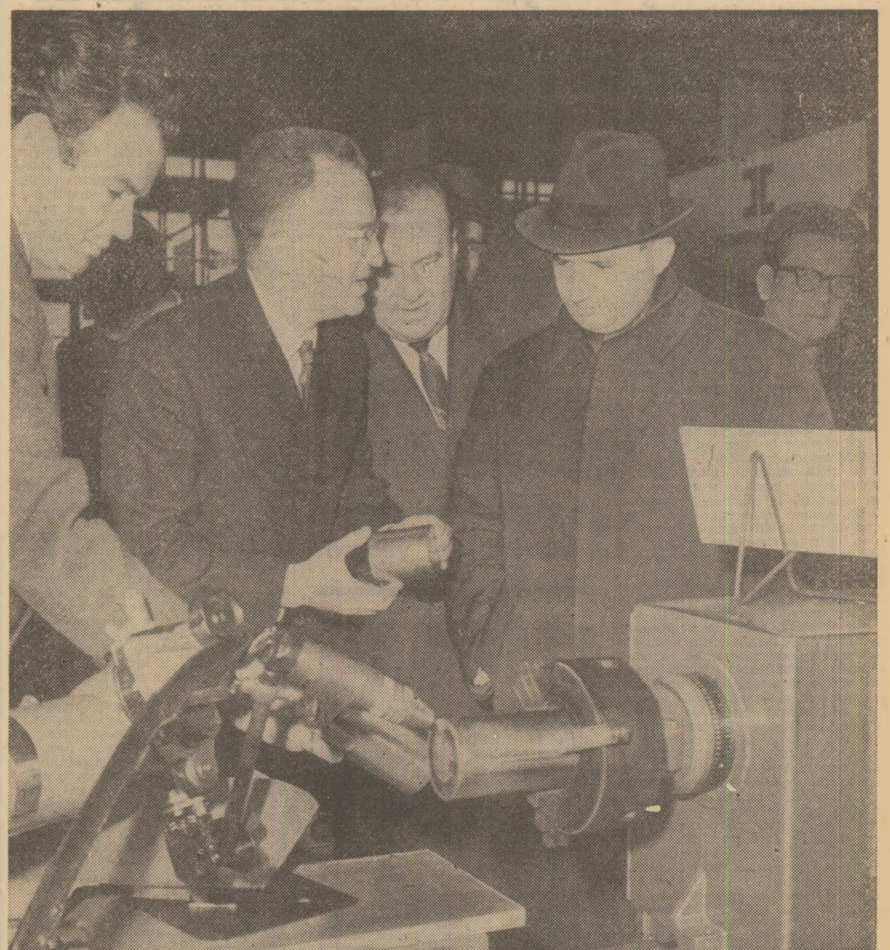
Secretarul general al partidului este informat asupra parametrilor tehnici și funcționali ai utilajelor expuse

Vizita continuă la standurile Grupului de uzine „23 August” din