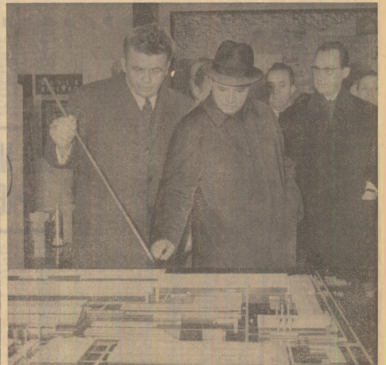
În fața machetelor unor obiective ale industriei metalurgice