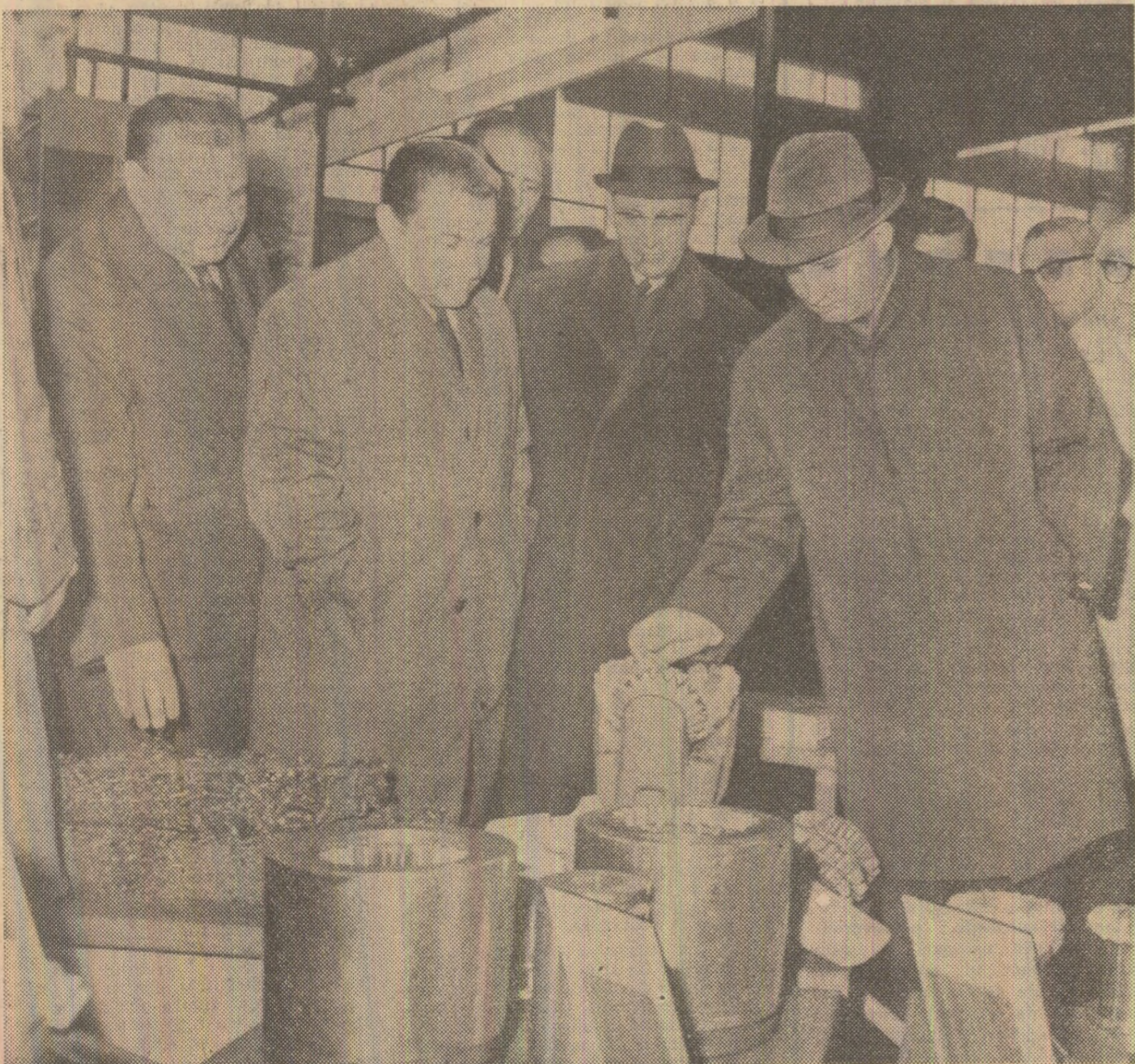
La unul din standuri, conducătorii de partid și de stat se interesează de calitatea produselor