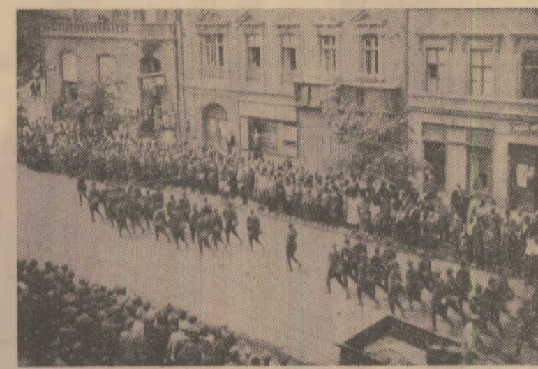
Anul 1945. Ostași români primiți cu căldură de populația orașului Brno.

fluențat într-o măsură importantă operațiile militare, contribuind considerabil la scurțarea războiului. „Întreaga României din Ază are o importanță covîrșitoare nu numai pentru această țară, dar și pentru întreaga Peninsulă Balcanică, deoarece prin această lovitură se prăbușește întregul sistem de dominație german din sud-estul Europei. Însemnătatea acestui din urmă