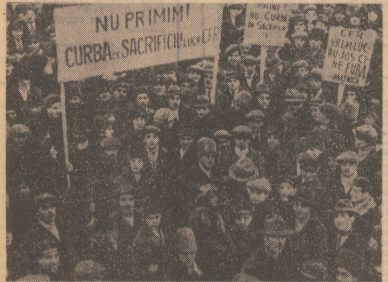
1929—1933. Demonstrație muncitorească în Capitală, la chemarea P.C.R., împotriva politicii claselor dominante de înfădurare față de monopolurile străine, a curelilor de sacrificii, pentru drepturi și o viață mai bună.

Deși singeros reprimată, marile lupte muncitorești conduse de partidul comunist în timpul crizei generale, au constituit, prin izbucnirile lor imediate și mai îndepărtate, o mare victorie politică a proletariatului român, impunînd guvernărilor sistarea „curelilor de sacrificii”, renunțarea la aplicarea faimoaselor „plan de la Geneva”, părăsirea țării de către controlorii străini.