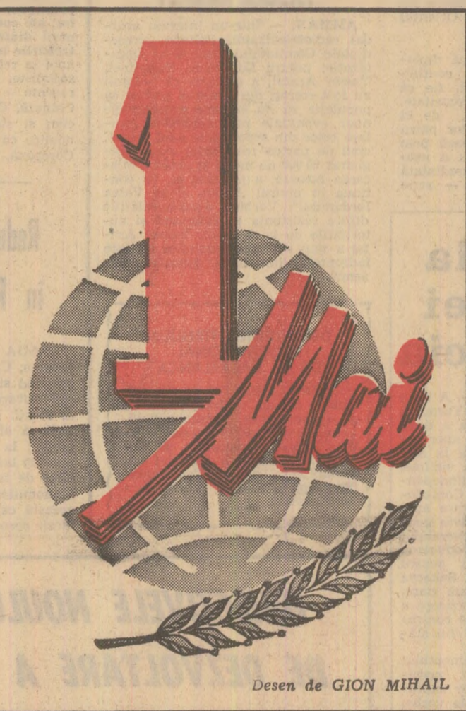
Desen de GION MIHAIL