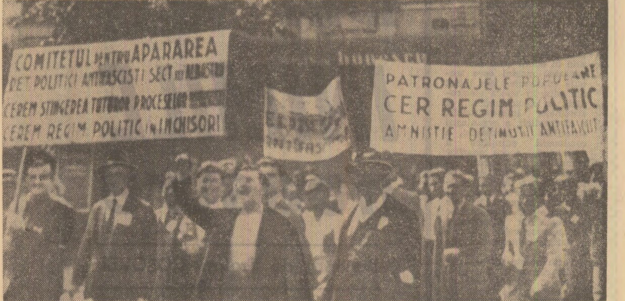
1935: glasul mulțimilor împotriva teroarei