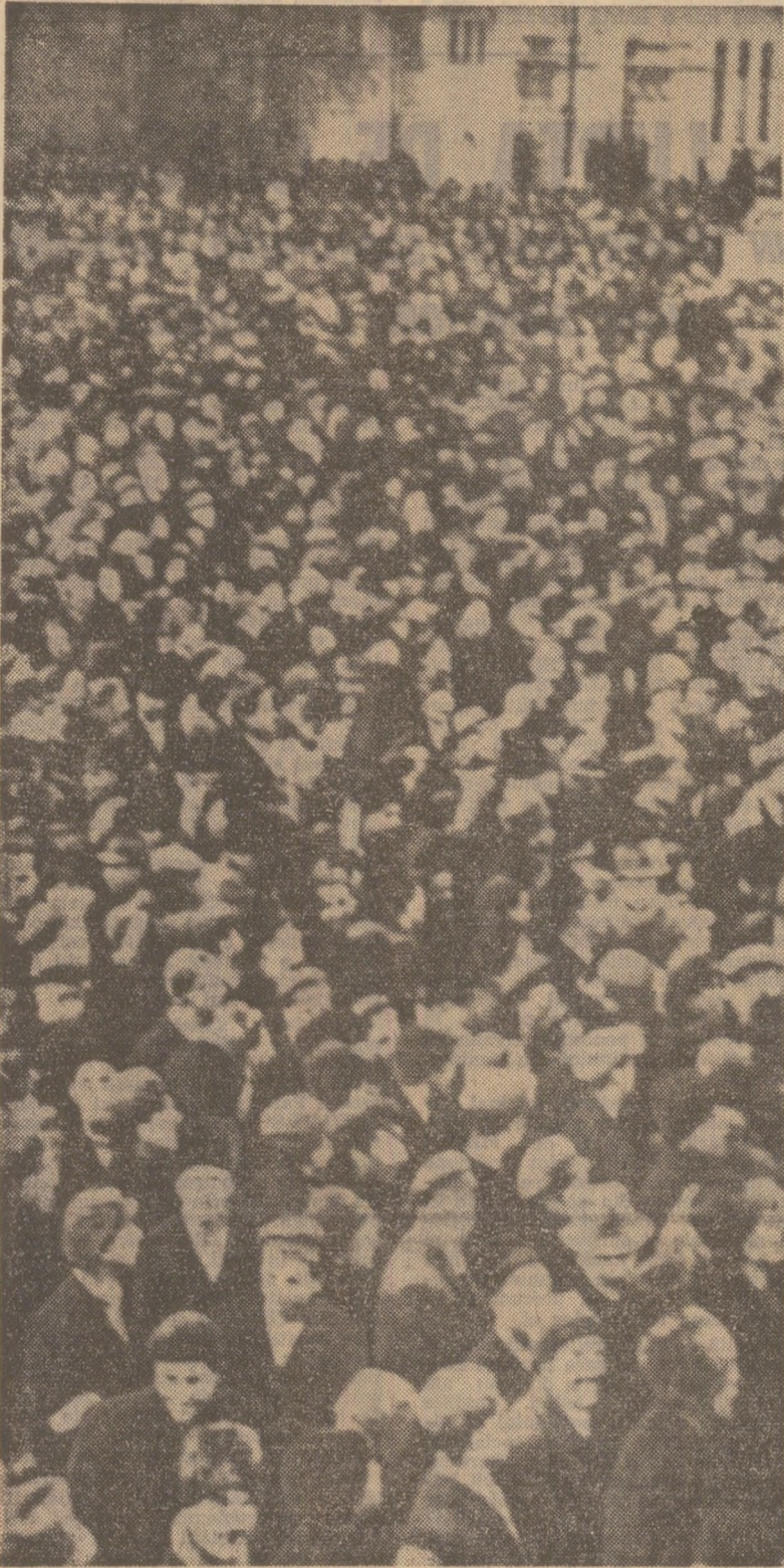
6 martie 1945: masele își impun voința, instaurînd puterea populară