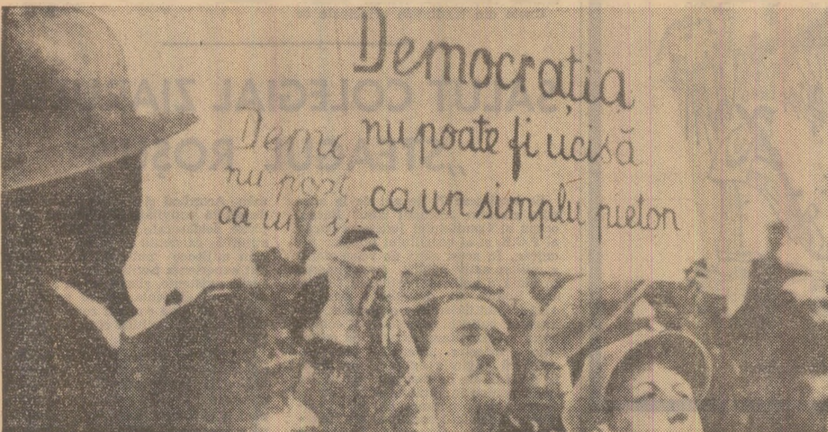
1936: verdictele străzii