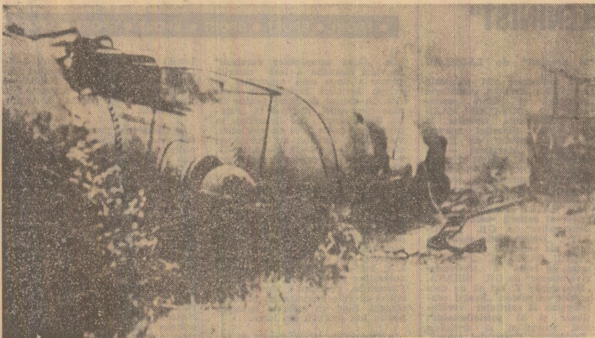
1943: act de sabotaj antifascist pe valea Prahovei