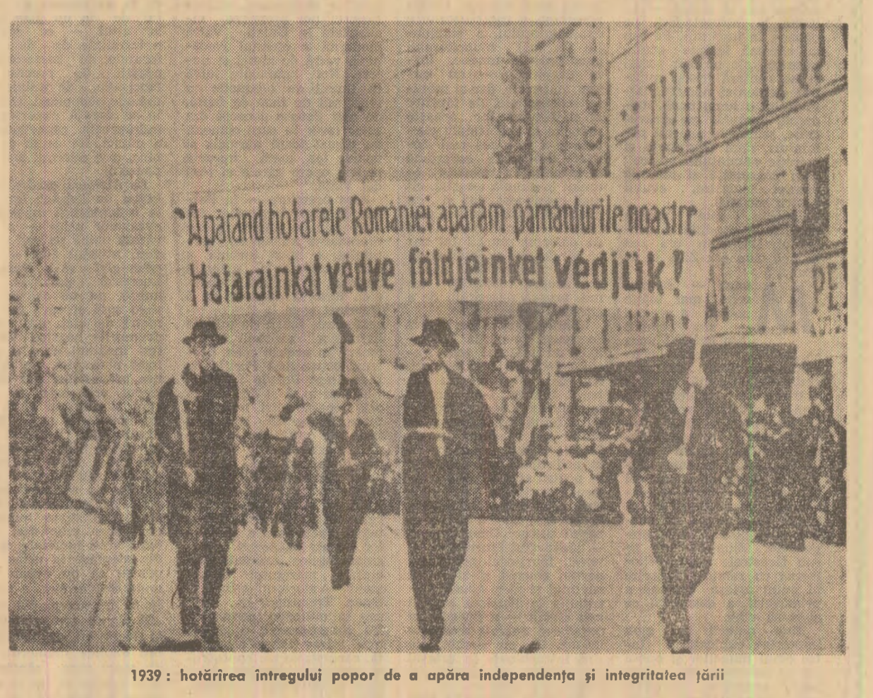
1939: hotărîrea întregului popor de a apăra independența și integritatea țării