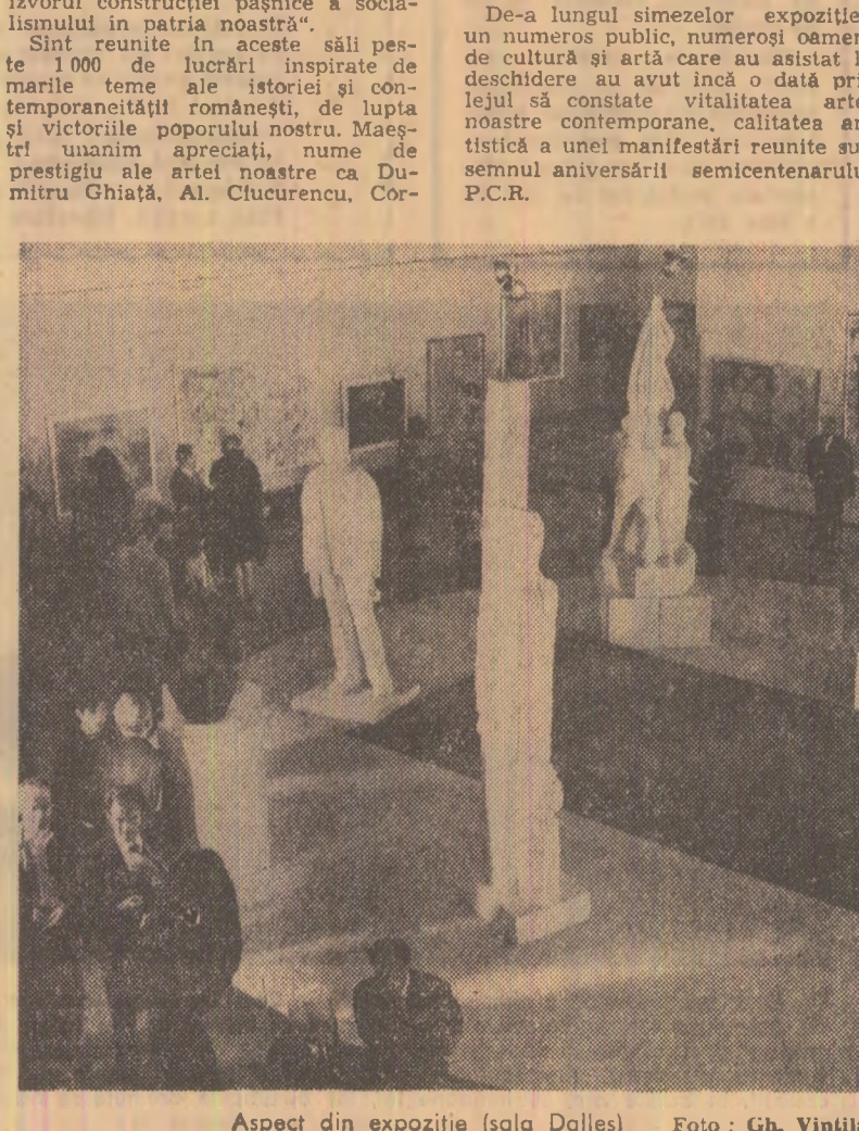
Aspect din expoziţie (sala Dalles)

În cuvîntul său inaugural, pictorul Brăduţ Covaliu, preşedintele Uniunii Artiştilor Plastici, sublinia: „Factor creator, mijloc de afirmare şi concept de artă superioară şi cultură, prezentul complex de expoziţii reprezintă atamarent artiştilor noştri la politica P.C.R., bucuria de a participa la marea sărbătoare, omagiuul nostru al tuturor către cel ce este izvorul construcţiei paşnice a socialismului în patria noastră”.