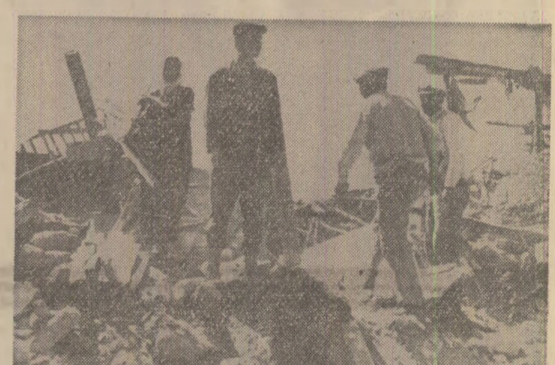
Turcia. Ultimele bilanșuri oficiale ale seismelor înregistrate în regiunea Burdur, situată în sud-vestul Anatoției; precizează că au fost înregistrate 50 de victime și că 1.550 de clădiri din zonele afectate de sinistra au fost distruse sau devenit neocuibile. Lucrările de îndlăturare a dărâmăturilor continuă

Pacificul. În fond, este un lanț neîntrerupt al căruia vârfuri oferă imaginea continuă a unui popor a cărui existență, istorie și cultură sînt strîns împletite cu marea. Clima aspră, solul mînos și acoperișurile proape în întregime cu piatră l-au îndreptat pe locuitorii acestor finituri spre nesfârșitul apelor, unde nu găsi o sursă sigură de hrană. Vechii locuitori erau cunoscuți ca navigatori iscușiți, pes-