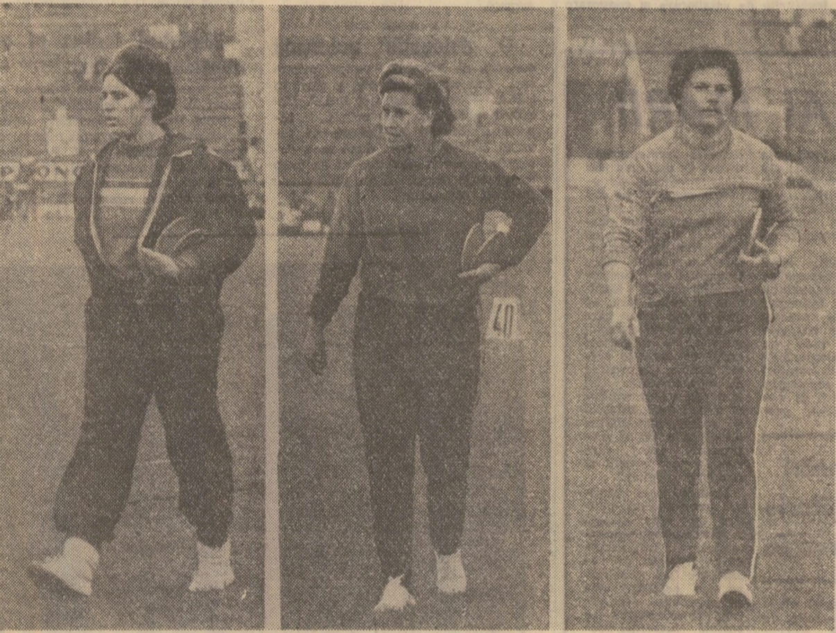
Discul feminin, cea mai valoroasă prezentă în atletismul românesc: în centru, Lia Manoliu, campioană olimpică, în dreapta, Olimpia Cătară, câștigătoare a concursului de primăvară...

„Semnele bune” ale unui nou sezon athletic