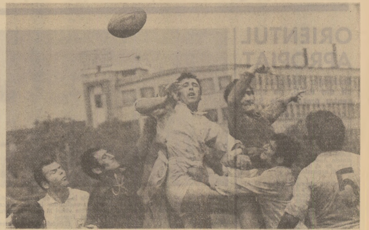
Rugbi, un joc pentru bărbații puternici (fază la lușă, din derbiul Steaua - „Grivița roșie”)