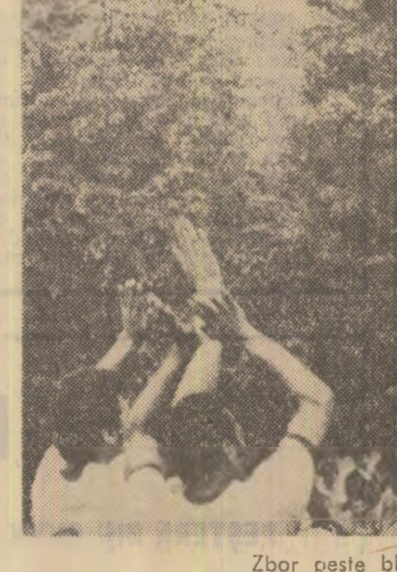
Zbor peste blocajul apărării...

Crisul - Gloria 1-0; Politehnica - C.F.R. Arad 2-0; C.S.M. Sibiu - Conul 0-0; Minerul Bala Mare - C.S.M. Resita 2-1; Olimpia Satu-Mare - Olimpia Oradea 1-0; Vagonul - Gaz Meian 3-1; Minerul Anina - Electroputere 3-0; Metalurgistul Cugir - U.M.T. 3-2. În clasament conduce Crisul (39 puncte), urmată de Politehnica (34 puncte).