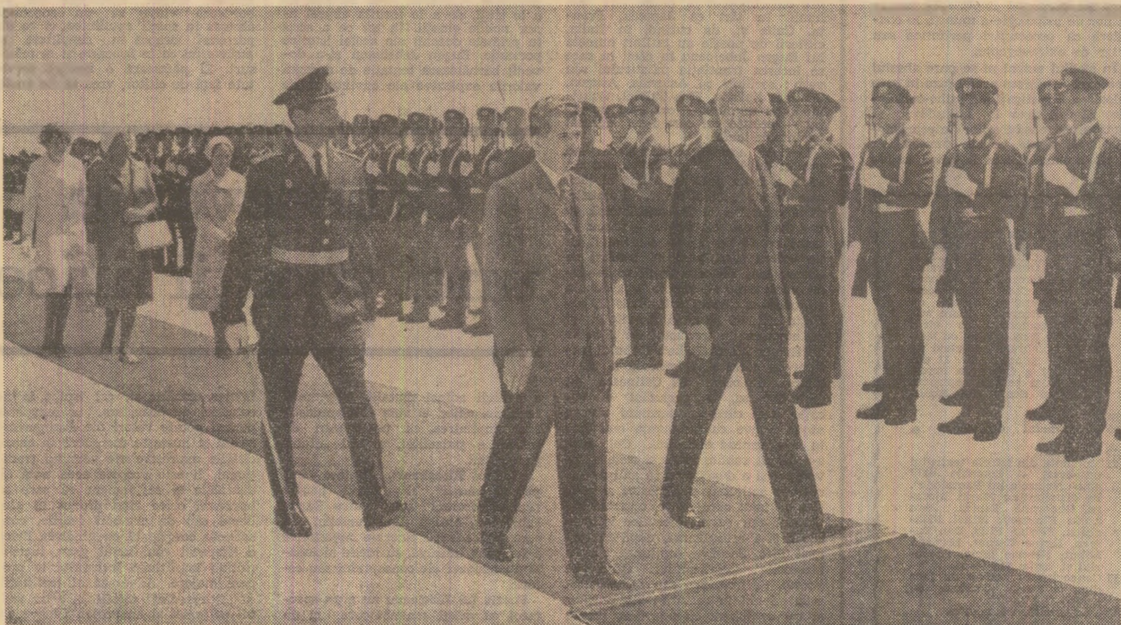
Se trece în revistă garda de onoare

Cel doi președinți răspund cu cordialitate manifestărilor de simpatie făcute de populația Capitalei. Opinia publică din țara noastră vede în vizita președintelui Gustav Heinemann în România un aport la dezvoltarea colaborării dintre cele două țări, la progresul dostinderii și securității pe continentul nostru și în restul lumii. (Agerpres)