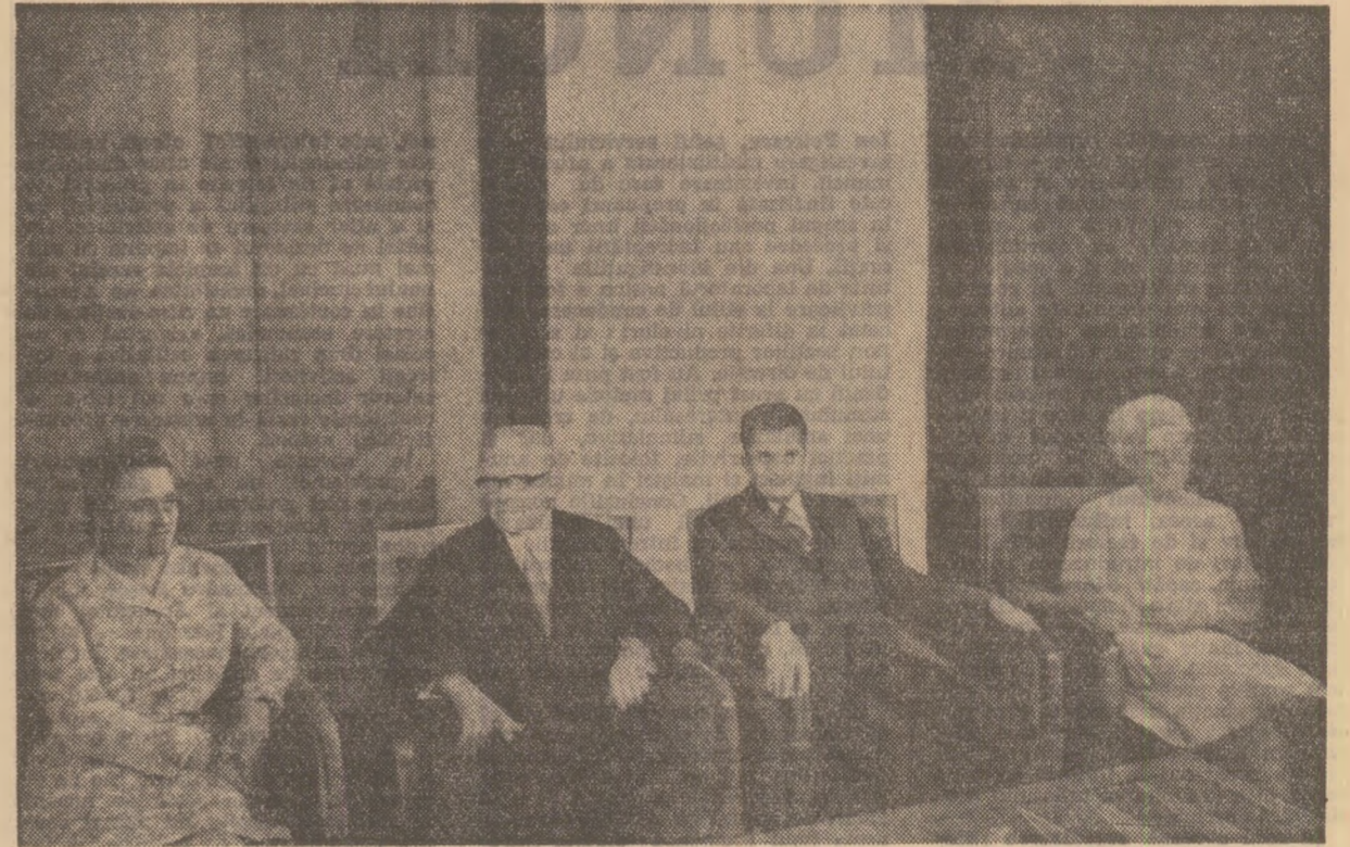
Vizită protocolară la Palatul Consiliului de Stat

Permiteți-mi să ridic acum paharul împreună cu însoțitorii mei și să beau în sănătatea dumneavoastră personală, domnule președinte, în sănătatea stimatei dumneavoastră soții, a tuturor oaspeților de față, în sănătatea popoarelor noastre și pentru o continuare a bunei colaborări în spiritul păcii și prieteniei.