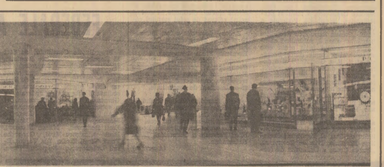
În pasajul subteran din Piața Universității

Este unul dintre cele mai noi și moderne edificii care au îmbogățit de curînd zestre arhitectonică a municipiului Arad. Clădirea monumentală a complexului, cu 12 niveluri, amplasată în plin centru civic al orașului, pune la dispoziția turiștilor și vizitatorilor 155 de camere confortabile cu 295 de paturi, precum și o varietate de servicii. În cadrul complexului hotelier „Astoria” funcționează un restaurant cu 160 de locuri, o