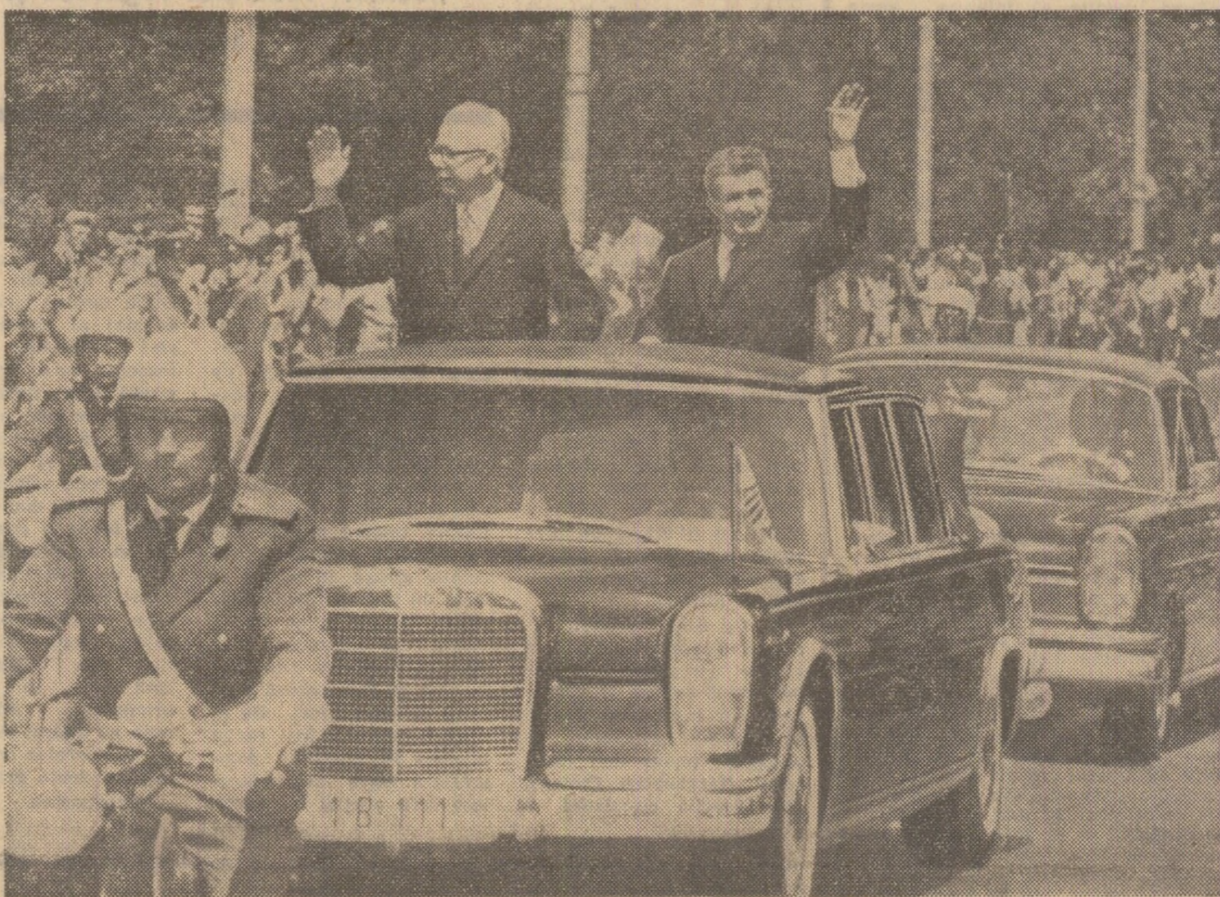
Cei doi președinți răspund cu cordialitate manifestărilor de simpatie făcute de bucureșteni