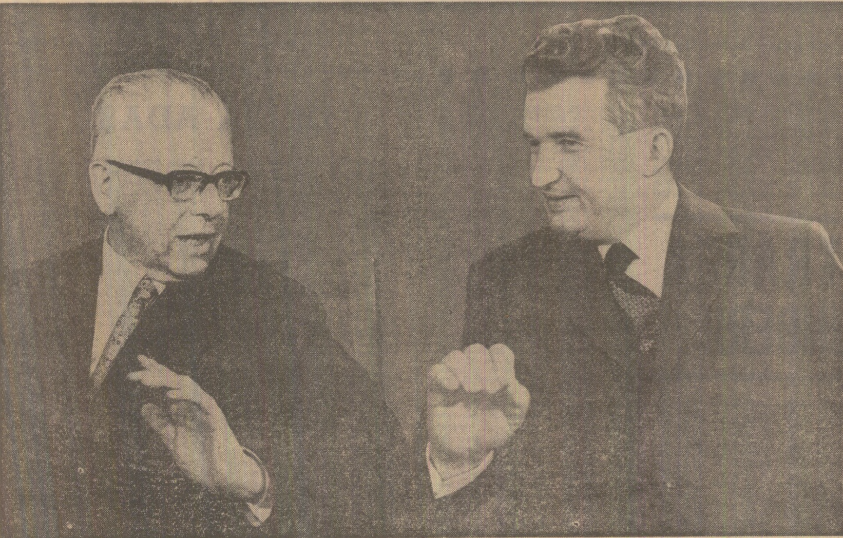
În timpul întrevederii dintre cei doi președinți