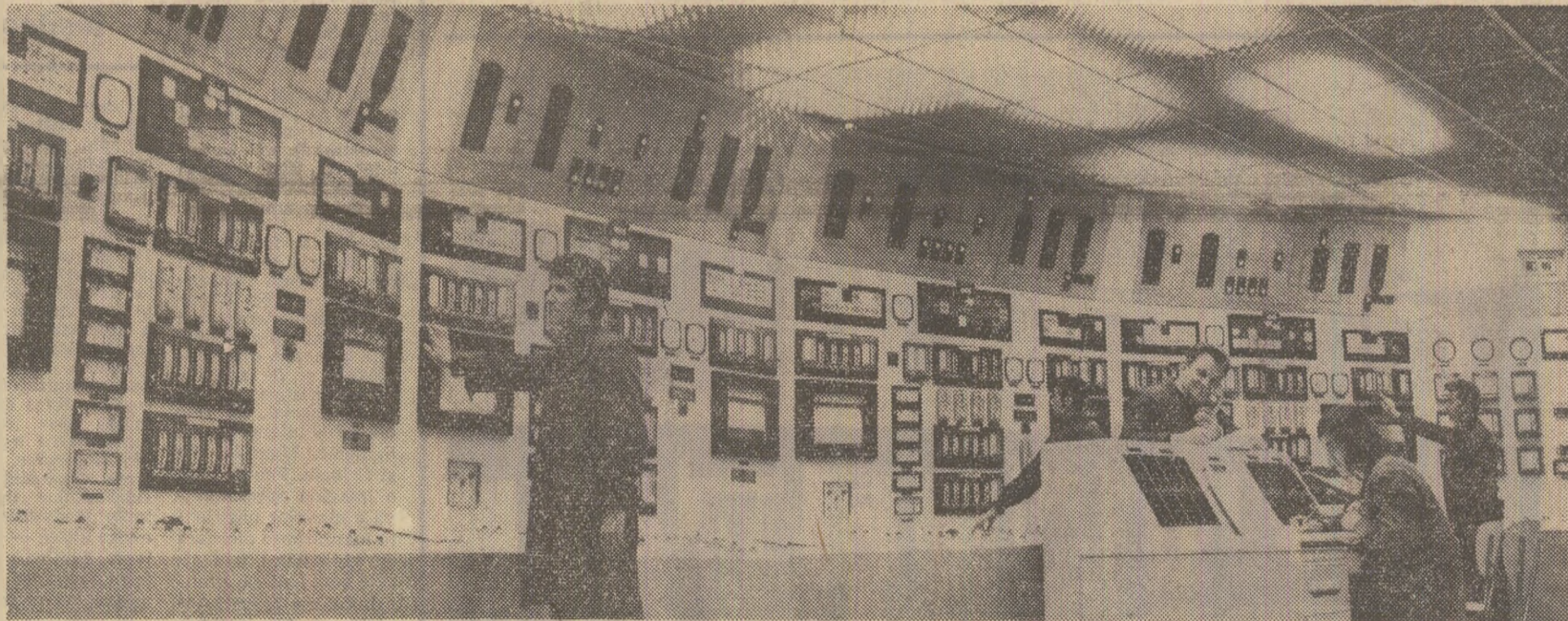
„Creierul” secției polițiene a Combinatului petrochimic Pitești

Locuințele de acest gen, care vor fi date în folosință începând din anul 1972, vor fi diferențiate prin număr de camere, echipare și preț pe trei categorii de confort.