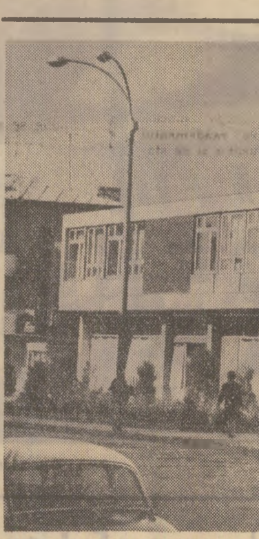
Giurgiu: un nou complex pentru deservirea populației.

pondentul nostru județean: „Cu ce se ocupă cei care răspund de transportul presei? De ce nu-i erigim în paginile ziarului?”. Întrebări pe deplin justificate, care dezvăluie o situație ce nu mai poate fi tolerată. A lăsa transportul și distribuția ziarului la latitudinea unuia... acar, a unui sofer, a unui funcționar oarecare este un act de irresponsabilitate, cu grave consecințe. Semnificativ pentru interesul cu care Poșta privește și soluționează problema organizării transportului și distribuției presei este situația conștinștată în zilele de 23 și 24 mai la Conștanța, pe litoral. Aici, la ora actuală, se află 20.000 turiști din