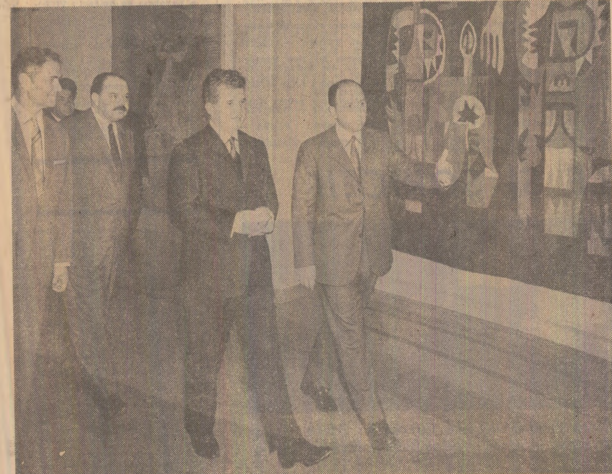
Vizitînd expoziția din sălile Ateneului Român

În cele patru săli ale expoziției sînt reunite aproape 1.000 de lucrări, selecționate din cele peste 3.000 care au fost prezentate juriului. Numărul mare al lucrărilor, calitatea lor, tematica bogată ilustrează revelator largul ecou pe care aniversarea partidului l-a avut în rîndul artiștilor din toate generațiile, români, maghiari, germani și de alte naționalități.