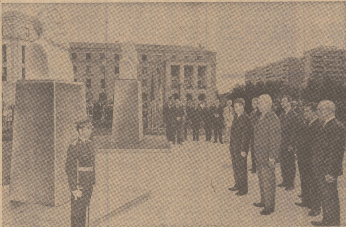
În timpul solemnității din piața „Marx-Engels”

„Dezvelirea busturilor lui Marx și Engels constituie un act de adîncă prețuire a întemeietorilor celei mai înaintate științe sociale — materialismul dialectic și istoric — a acelora care au pus bazele con-