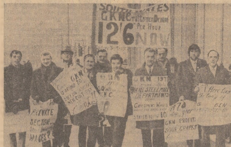
Pe străzile Londrei, muncitorii oțelari din sudul Wales-ului au organizat o demonstrație în sprijinul revendicărilor lor materiale

Cel de-al XIV-lea congres a fost salutat de reprezentanții unor partide comuniste și muncitorești. Lucrările congresului continuă.