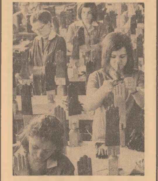
Una din secțiile fabricii

SE EXTRINDE FABRICA DE PIELE ȘI MĂNUȘI DIN TG. MUREȘ TG. MUREȘ (corespondentul „Scintei”, I. Deak). — La fabrica de piele și mână din TG. Mureș, unitate care în anul 1970 a cunoscut un amplu proces de modernizare și dezvoltare, se execută acum în continuare însemnate lucrări de investiții: mărirea halelor de producție prin completări și supraetajări, reorganizarea unor suprafețe productive, modernizarea proceselor tehnologice etc. Capacitatea fabricii va spori anual cu un milion perechi mănuși din piele și 16.300 bucăți confecții. Noile capacități urmează să fie dotate cu mașini și utilaje de înaltă tehnologie, linii automate de mare randament, în majoritate produse în țară. Din dările de seamă statistice, care sintetizează activitatea executanților, I.C.M. Cluj, rezultă că planul de producție prevăzut pentru trimestrul I s-a realizat în proporție de 120 la sută la investiții, total și 155 la sută la construcții montaj.