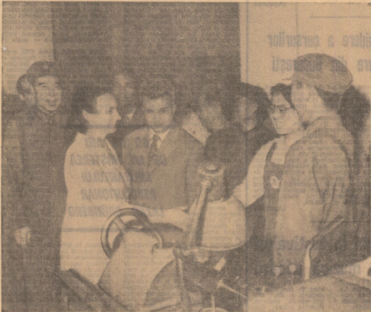
Primire caldă, cordială în laboratoarele Universității politehnice Cihua