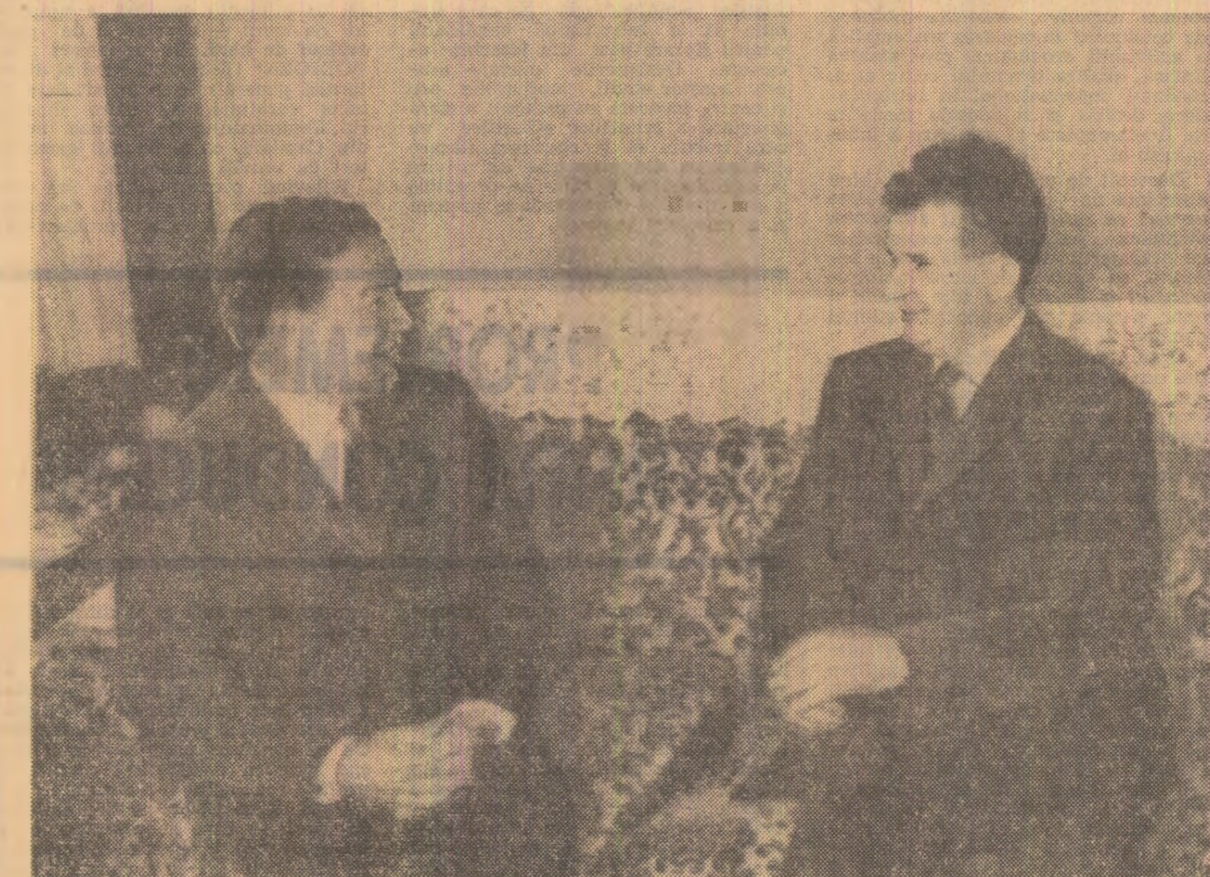
În timpul convorbirii între președintele Nicolae Ceaușescu și prințul Norodom Sianuk

Convorbirile s-au desfășurat într-o atmosferă cordială, prietenească.