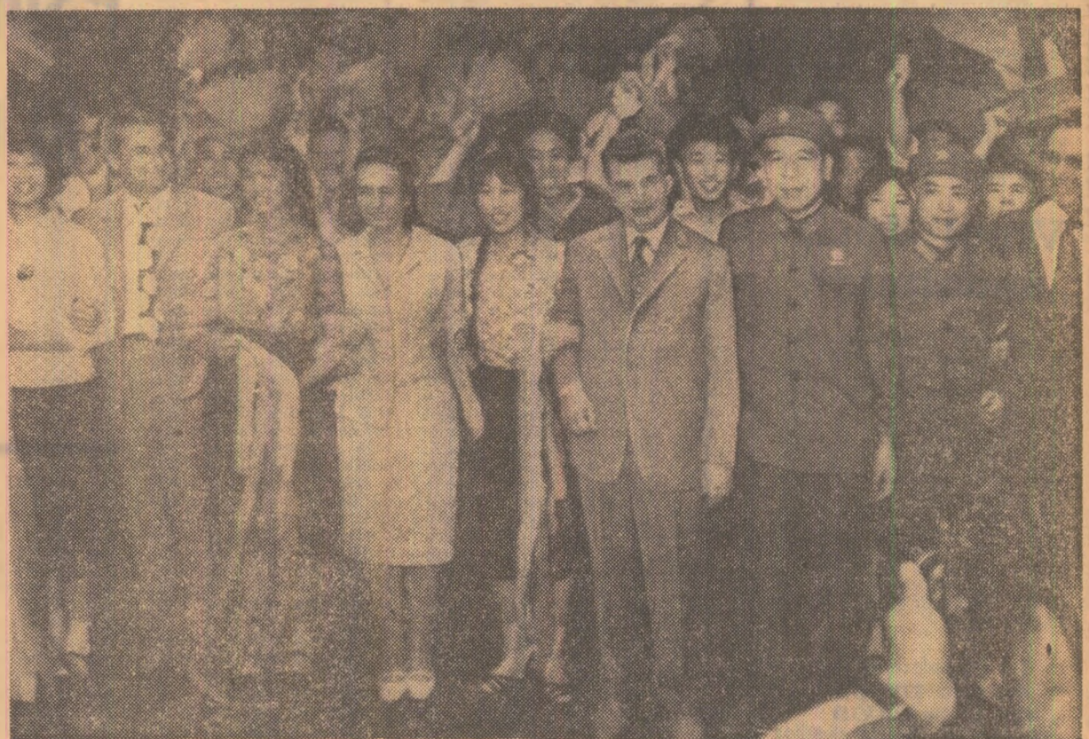
În mijlocul studenților și profesorilor de la Universitatea politehnică Cinhua