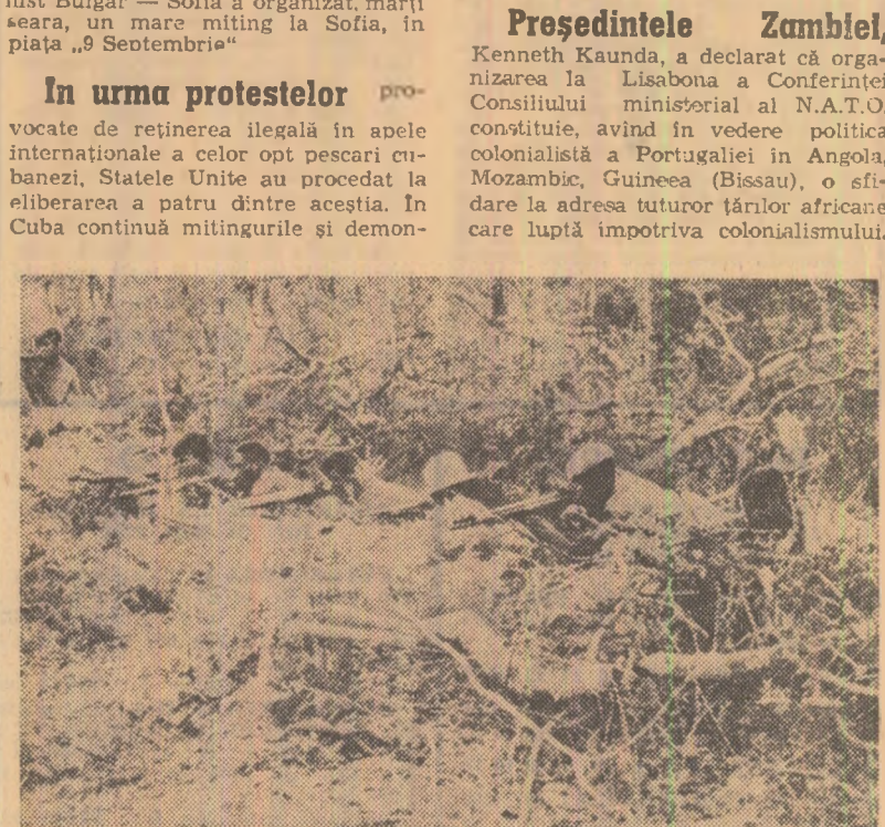
Angola. O unitate a forțelor patriotice lansind un nou atac împotriva trupelor colonialiste portugheze

Președintele Zambiei, Kenneth Kaunda, a declarat că organizarea la Lisabona a Conferinței Consiliului ministerial al N.A.T.O. constituie, avind în vedere politica colonialistă a Portugaliei în Angola, Mozambic, Guinea (Bissau), o sfidare la adresa tuturor țărilor africane care luptă împotriva colonialismului.