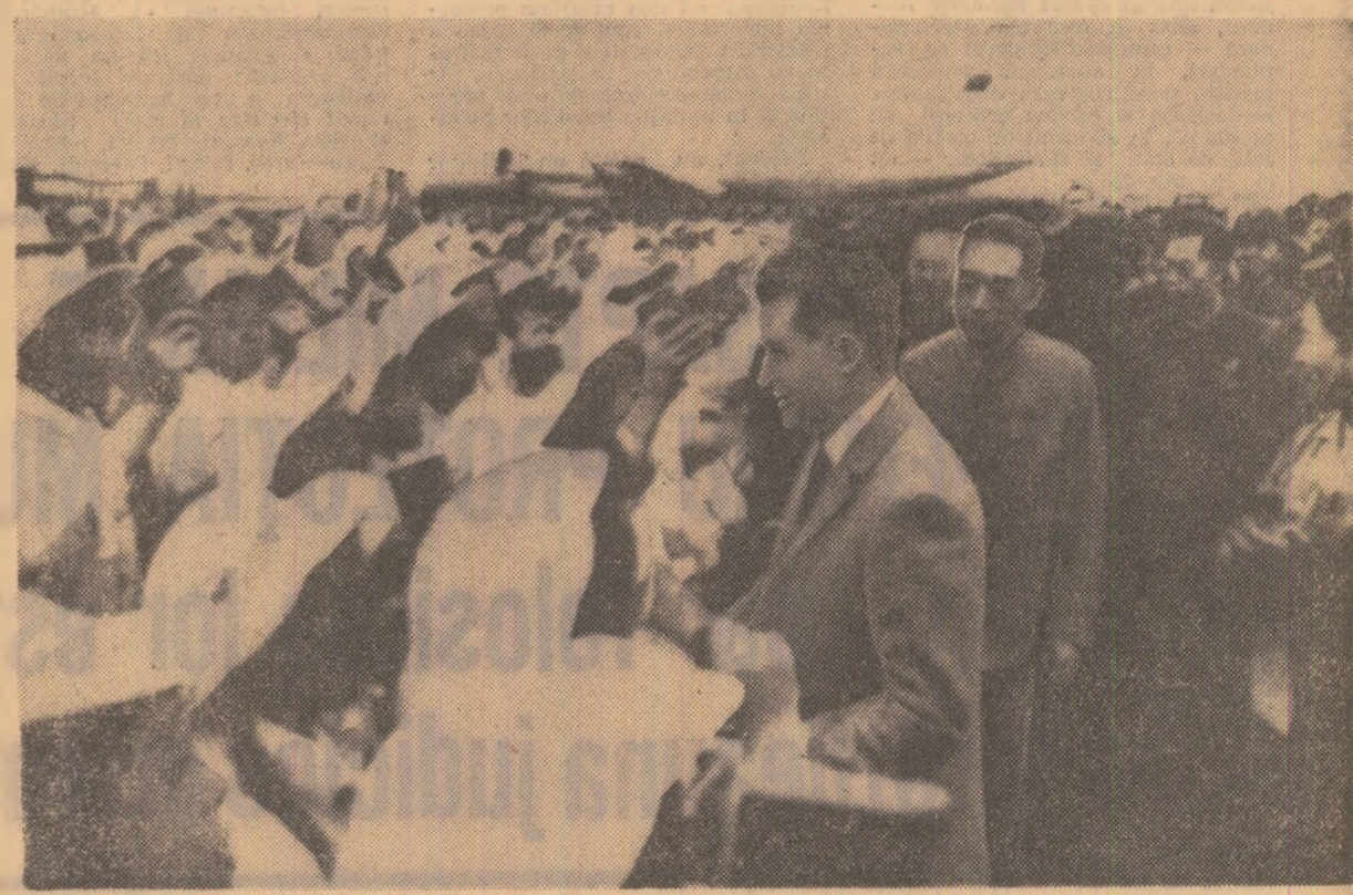
Tovarășul Nicolae Ceaușescu este întâmpinat cu căldură și simță pe aeroportul din Nankin