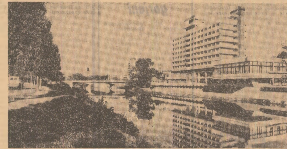
Hotel „Dacia” din Oradea