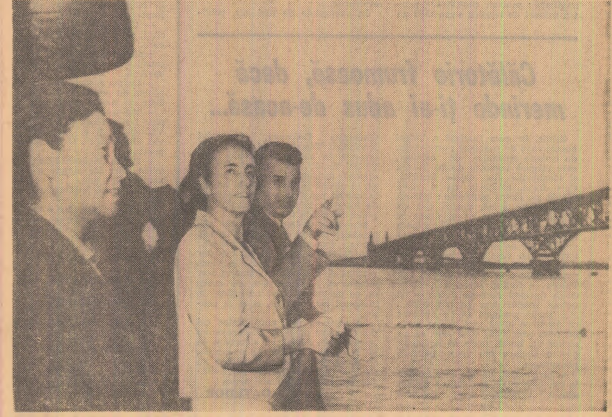
La bordul unei nave, oaspeții români se îndreaptă spre marea pod de pe fluviul Iantzi

La aceste ore de dinaintea amiezii, străzile sînt înțesate de oameni. Imaginea picoromă a eșarfelelor de mătase care sînt fluturate,