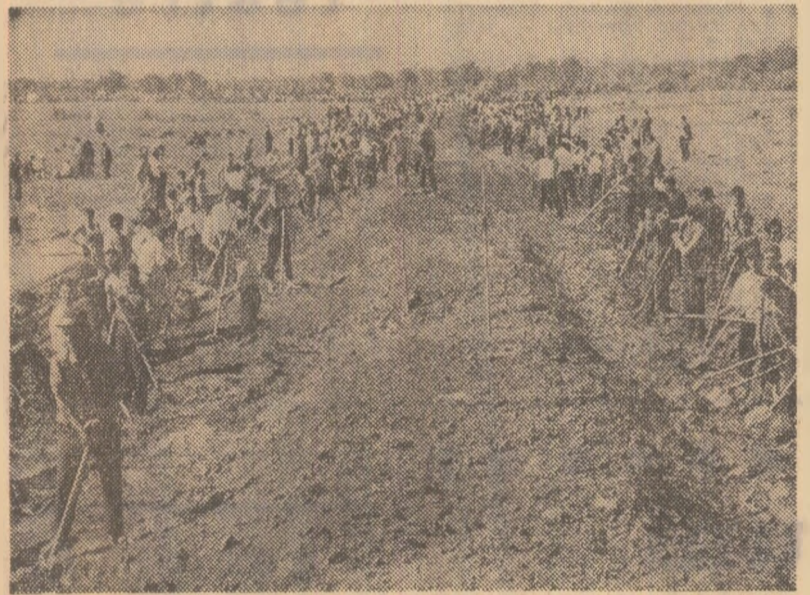
Mii de oameni ai muncii din întreprinderile municipiului Focșani, împreună cu cooperatorii, au lucrat ieri la îndălțarea digului de pe malul Punei.