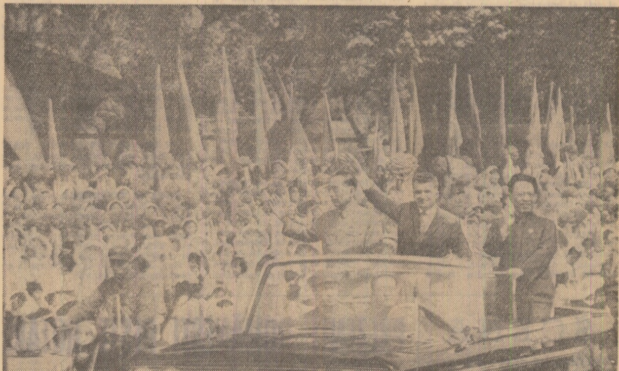
Populația orașului Șanghai a făcut o primire călduroasă înălților oaspeții români.