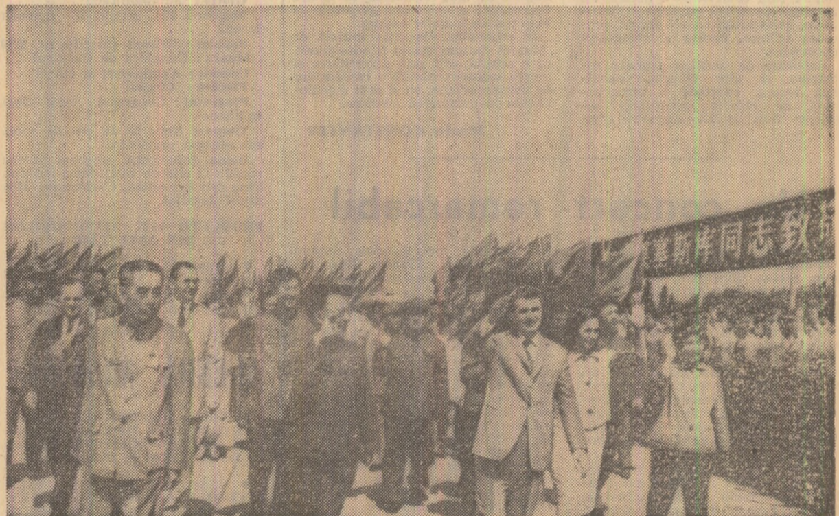
La sosire pe aeroportul Șanghai.