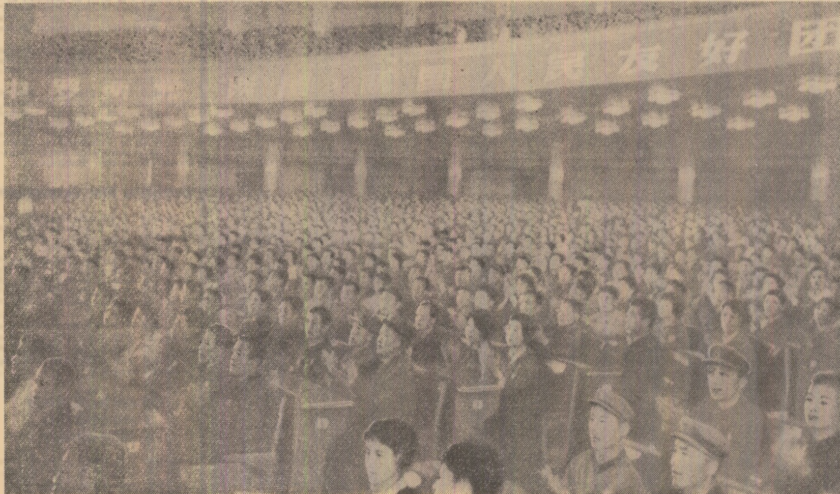
Aspect din timpul mitingului

Trăiască marxism-leninismul și internaționalismul proletar! (VII și puternice aplauze).