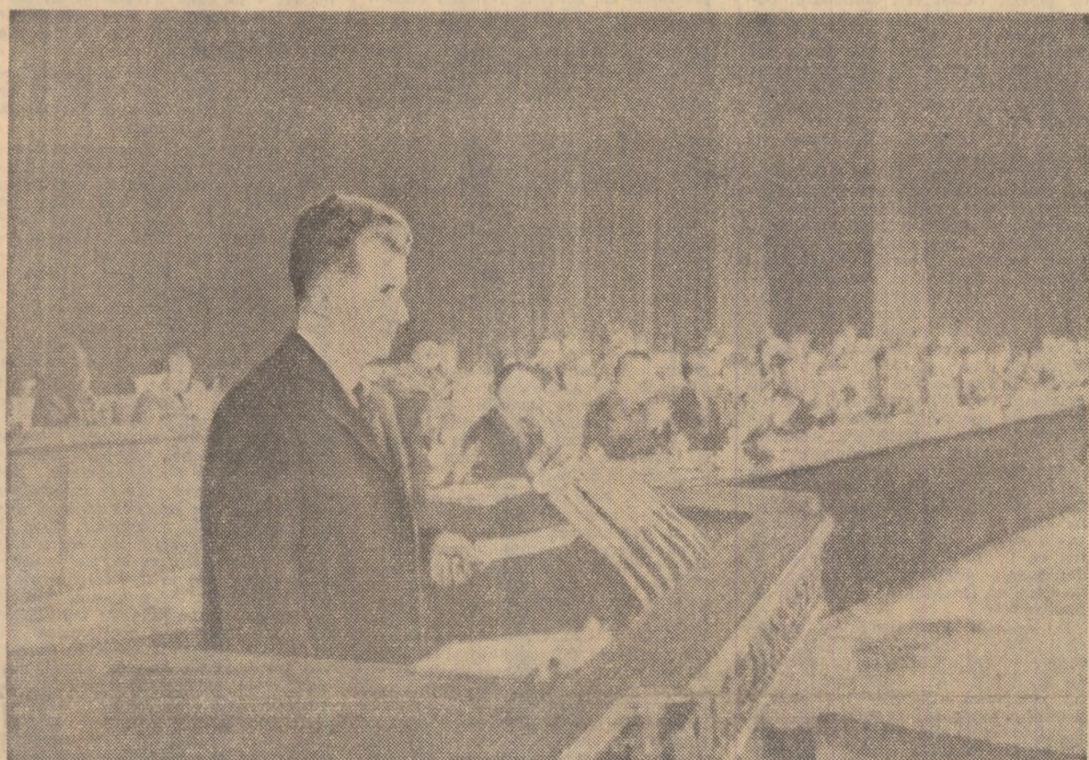
La marele miting al prieteniei româno-chineze