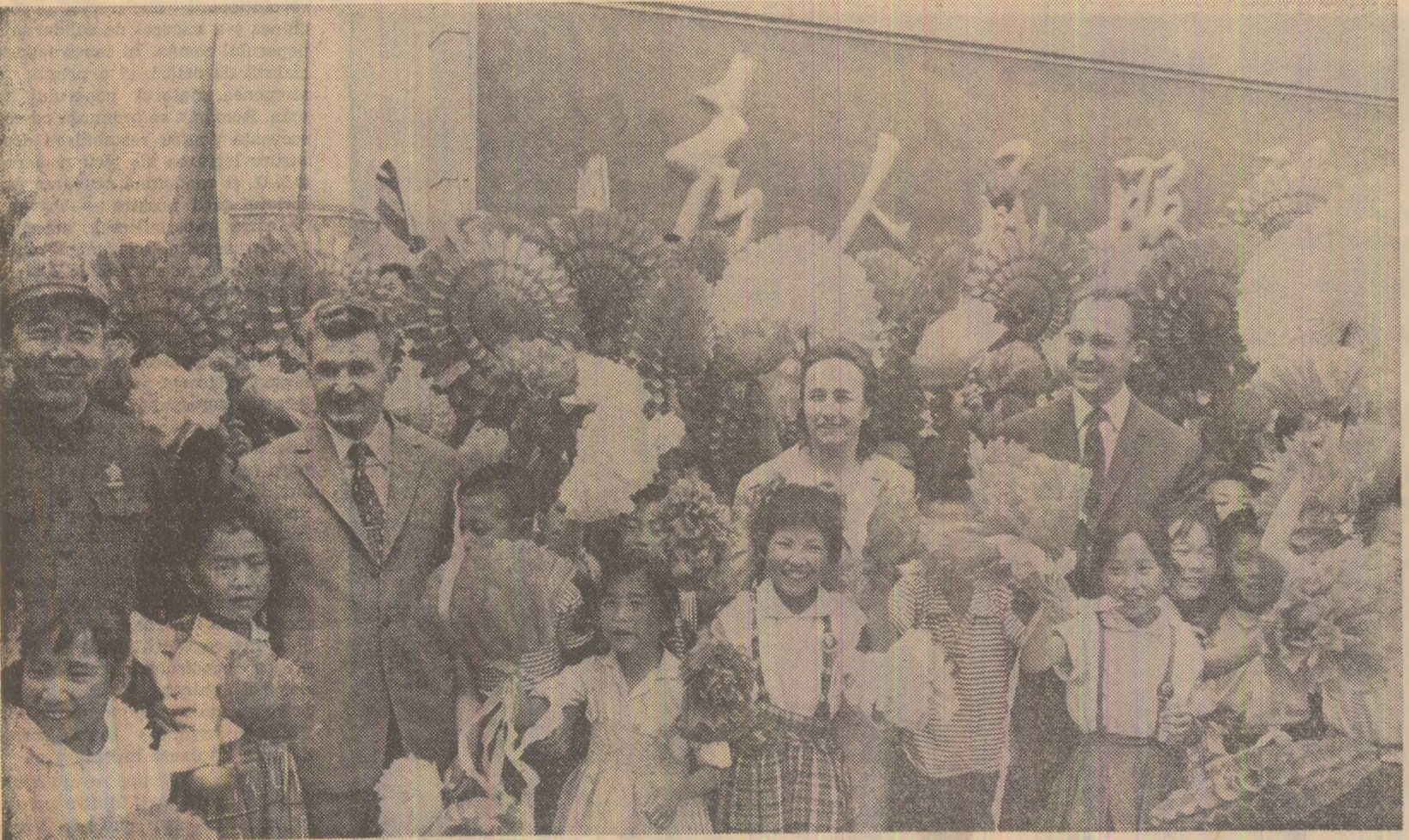
Pretutindeni, în timpul vizitei, simpatie și dragoste, primire călduroasă