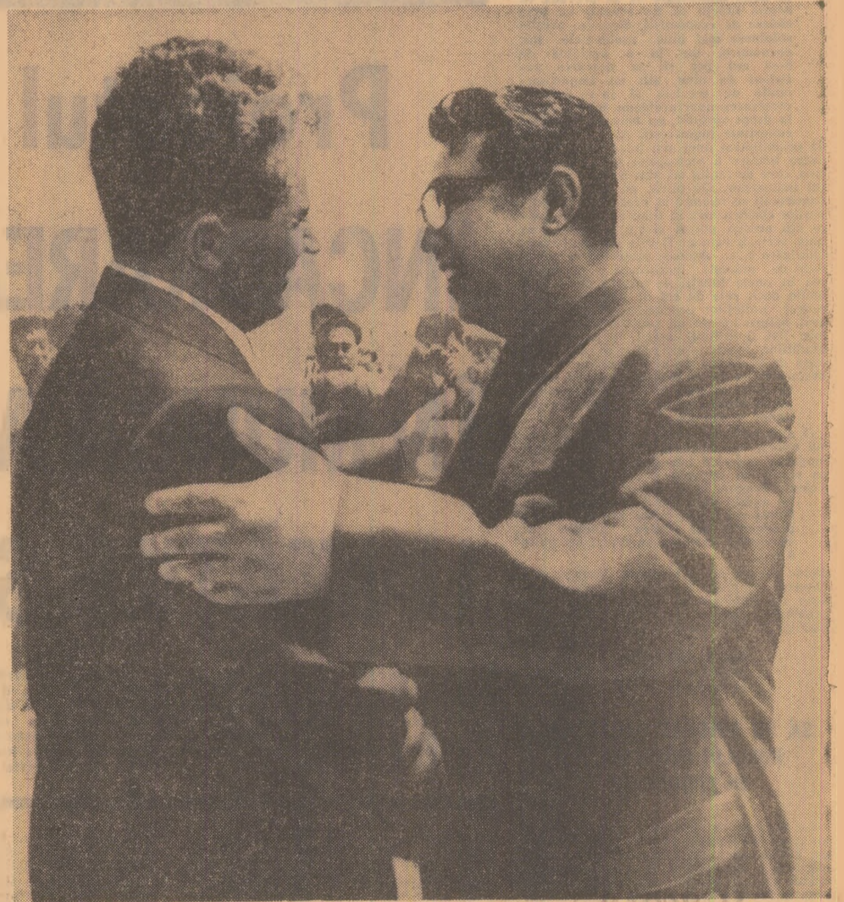
La plecare, pe aeroportul Sun An