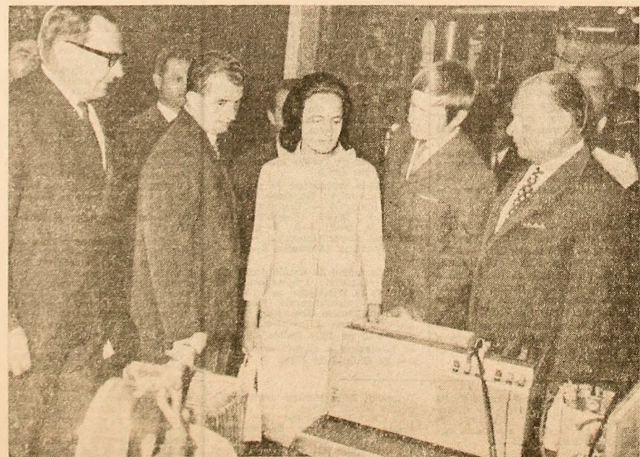
În „Orașul politehnic” al studenților de la Otaniemi

Primul popas în „Orașul politehnic” al studenților de la Otaniemi are loc în marea aula a institutului, construcție ale cărei forme geometrice creează clădirii o dublă funcționalitate: un imens amfiteatru în interior, utilat cu tot ce este necesar prelegerilor științifice, și un al doilea, în exterior, sub