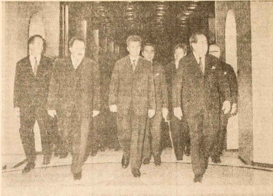
Tovarășul Nicolae Ceaușescu și ceilalți membri ai delegației române, oaspeți ai președintelui Parlamentului finlandez, Rafael Paasio

Președintele Nicolae Ceaușescu a răspuns, toastînd în sănătatea președintelui Urho Kekkonen, a președintelui Consiliului de Miniștri, a președintelui Consiliului Municipal, în sănătatea tuturor persoanelor oficiale prezente la dejun.