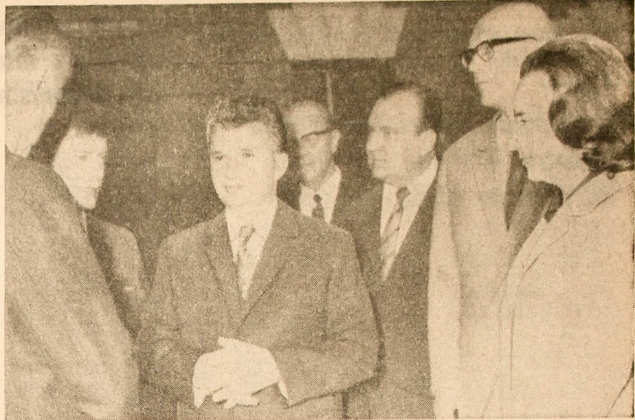
La concertul industrial „Valmet Oy” din Helsinki