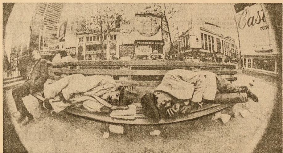
New York 1971: Oameni fără lucru, fără locuință...