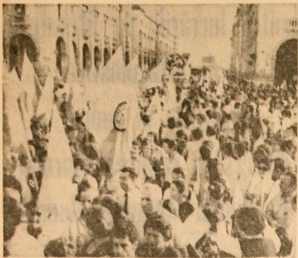
Malta. Zeci de mii de adepți ai Partidului laborist demonstrând pe străzile orașului Floriana, în sprijinul politicii noului guvern al Maltei, care este îndreptat spre înlocuirea prezentei N.A.T.O. în insulă.