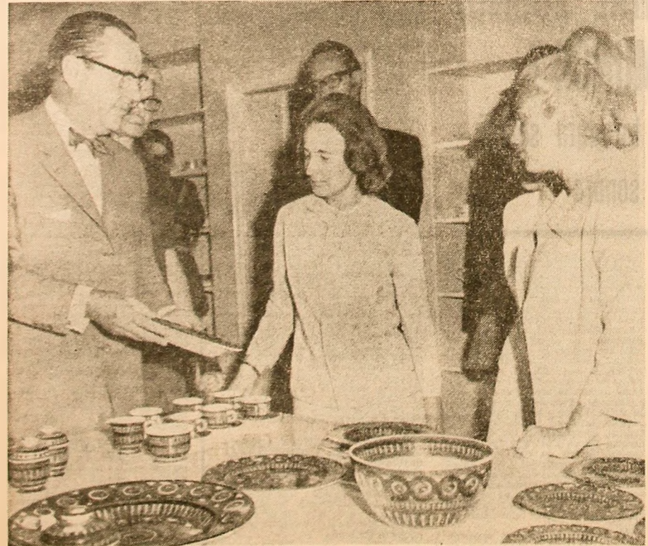
Imagine din timpul vizitei tovarăşii Elena Ceauşescu, făcută în cursul zilei de miercuri la fabrica „Arabia”

În cursul dineului, au fost evocate aspecte ale relaţiilor dintre industriile celor două ţări, precum şi perspectivele de dezvoltare a colaborării bilaterale.