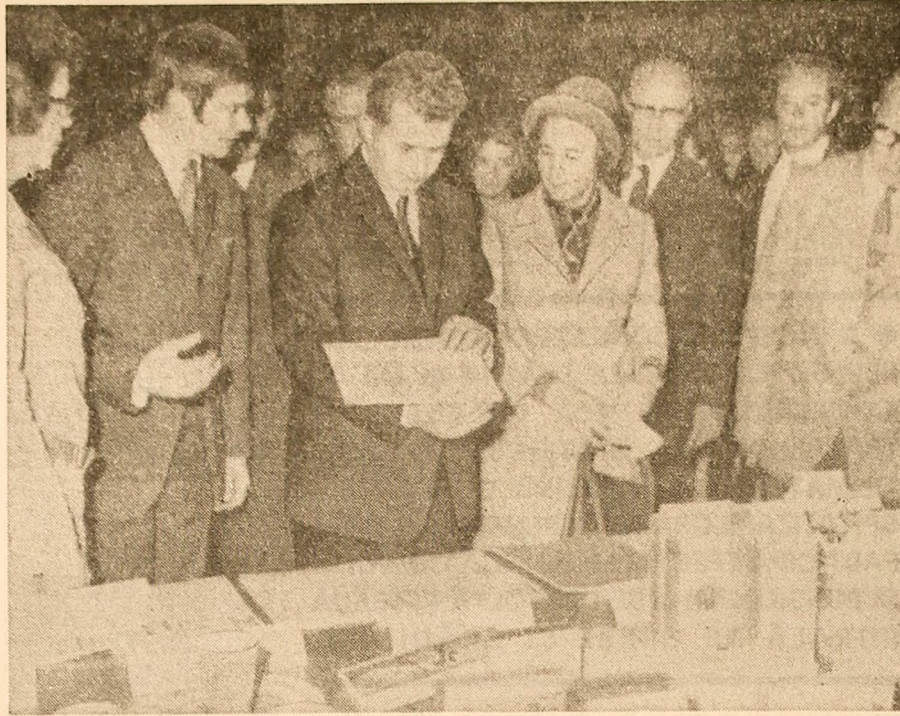
La una din întreprinderile „Enso-Gutzeit Osakeyhtio” din Imatra

Intrevederea dintre şeful statului român şi membrii conducerii Asociaţiei Finlanda-România a decurs într-o atmosferă prietenească. În spiritul relaţiilor dintre cele două popoare.