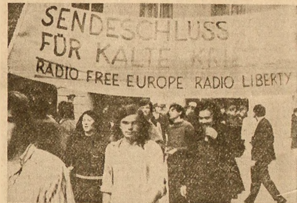
R.E.G.: Demonstrații pe străzile München-ului, orașul vizitarei Olimpiadei, cer încetarea emisiilor posturilor de radiu „Europa Liberă” și „Libertatea”, instrumente ale politicii discreditate a războiului rece

HELSINKI 8 (Agerpres). — La sediul ambasadei sovietice din Helsinki a avut loc joi prima ședință a celei de-a cincea runde din cadrul convorbirilor sovieto-americane asupra limitării cursei înarmărilor strategice (S.A.L.T.). Convorbirile propriu-zise, care au durat 70 de minute, au fost precedate de o reuniune de informare, în cursul căreia șefii celor două delegații — Vladimir Se-