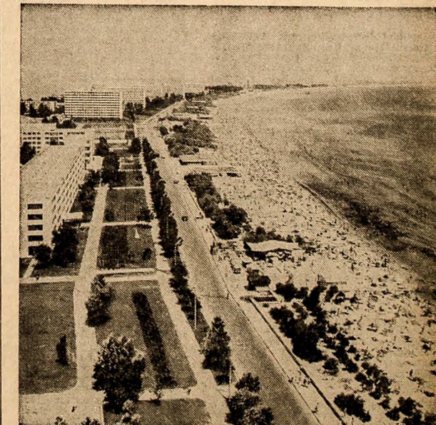
În aceste zile, la Mamaia