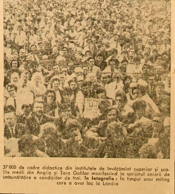
37.000 de cadre didactice din institutele de învățămînt superior și școlile medii din Anglia și Tara Gallilor manifestînd în sprijinul cererii de îmbunătățire a condițiilor de trai. În fotografie: în timpul unui miting care a avut loc la Londra

Într-o altă parte, simbioză și dominanță parca de est a Austriei a fost bîntuie de o puternică furtună, însoțită de ploți torențiale. După cum apreciază presa austriacă, pagubele pricinuite de furtună se ridică la zece de milioane de șilingi.