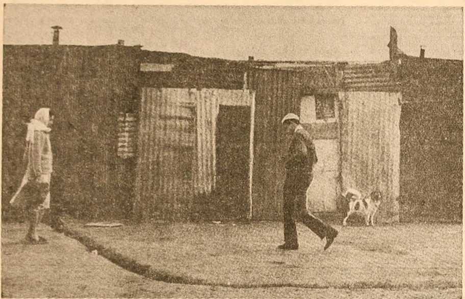
Bidonville într-un cartier parizian

● Pe treptele cele mai de jos ale ierarhiei salariilor ● Unul din doi este analfabet ● „Cu ce mă întorc acasă?! Cu un tranzistor și... multă amarăciune“ ● O zi la „Hanul dezmoșteniților“ din arondismentul XIX