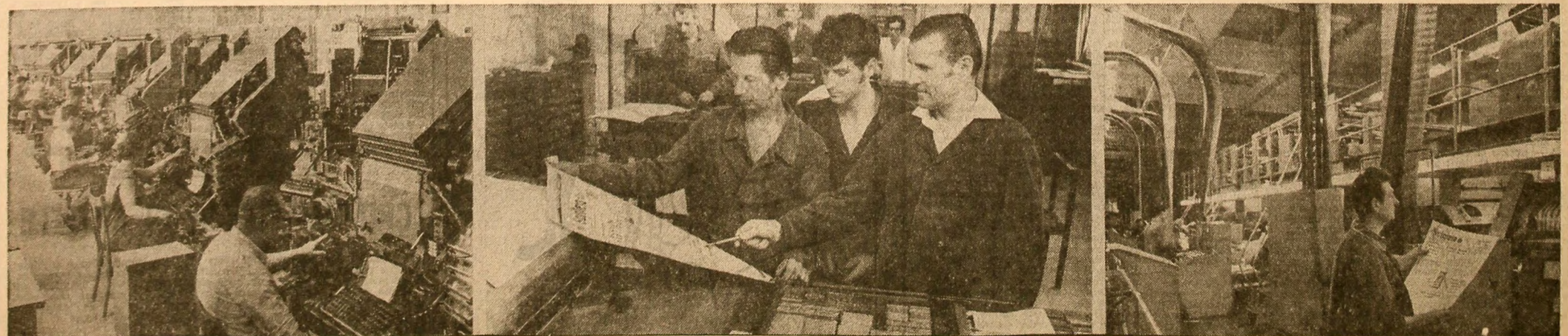
Imagini din august 1971 de la combinatul Casa Scinteia. Secția linotype. Paginatorii "Scinteia". Un ziar proaspăt scos din marile rotative