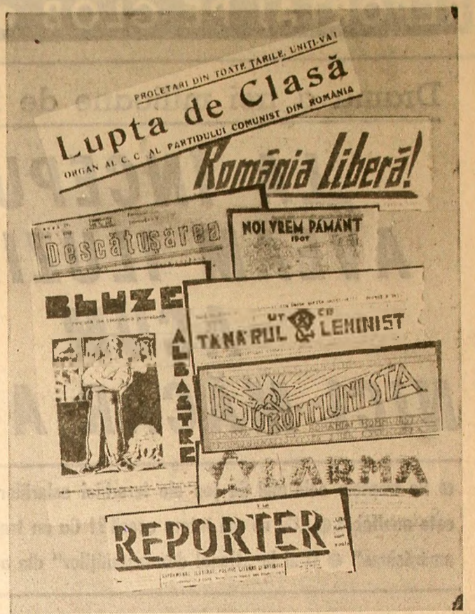
Publicații comuniste apărute în condițiile ilegalității. (Dintre ele, revistele "Bluze albastre" și "Reporter" au apărut legal)