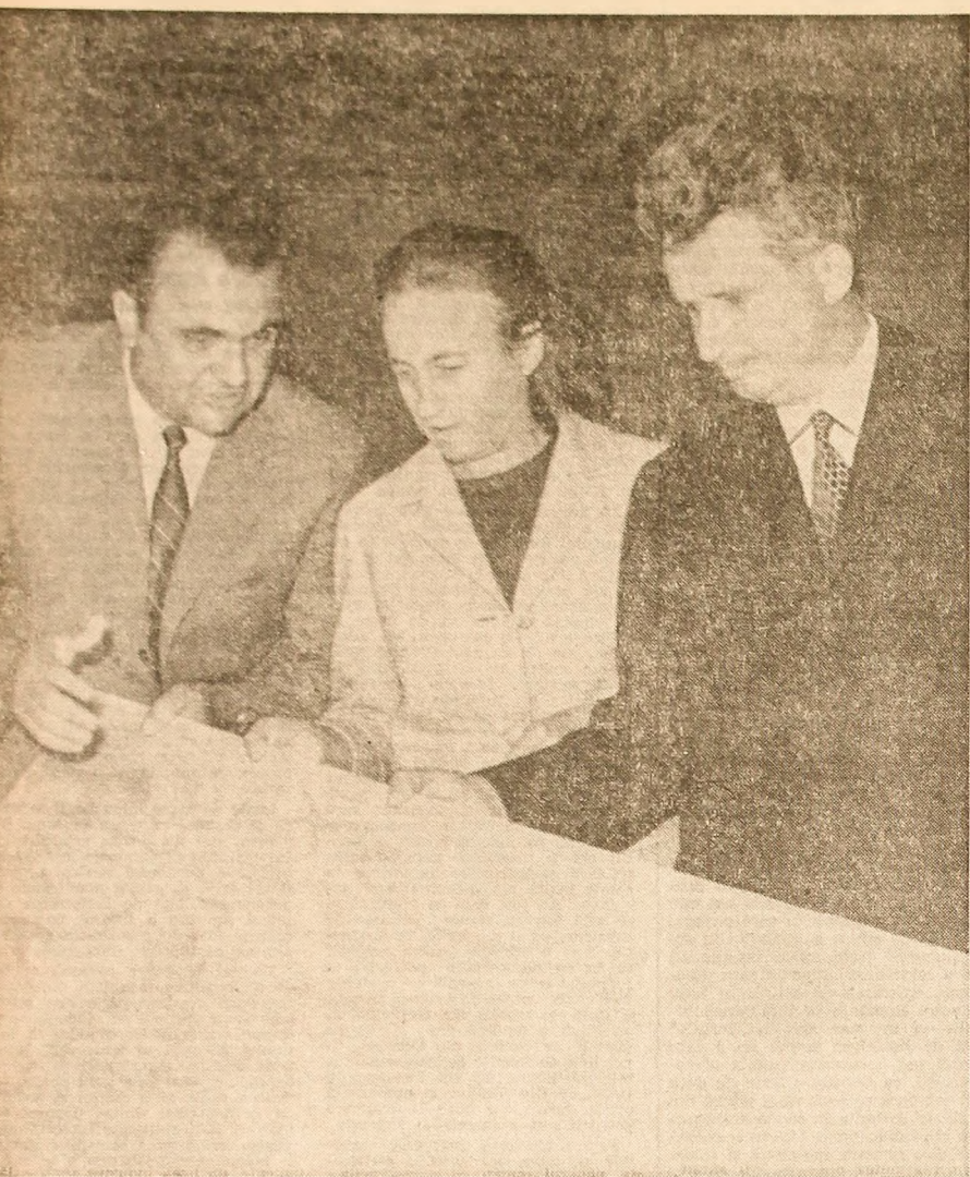
Examinare atentă, la foja locului, a calităţii produselor executate la C.I.L. Gălăuţaş

instrucativ-educativă legată de viaţa, pentru formarea în spirit socialist a tinerilor.