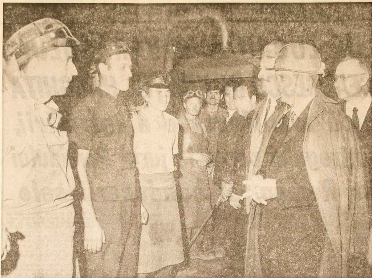
În mijlocul muncitorilor de la Vlăhija. Moment elocvent al activității practice a secretarului general al partidului: dialogul viu, permanent, cu poporul

În încheiere, vă urez să obțineți noi succese în activitatea dumneavoastră și vă doresc multă sănătate și multă fericire la toți. (Aplauze prelungite; ovății se scîndează: „Ceaușescu — P.C.R.”).