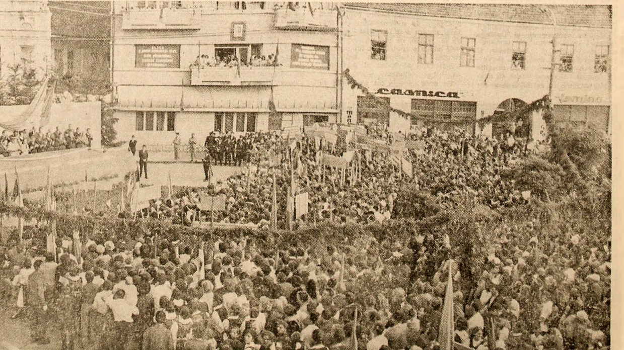
Mii de cetățeni români, maghiari și de alte naționalități din orașul Gheorgheni au făcut conducătorilor de partid și de stat o primire entuziasă, călduroasă