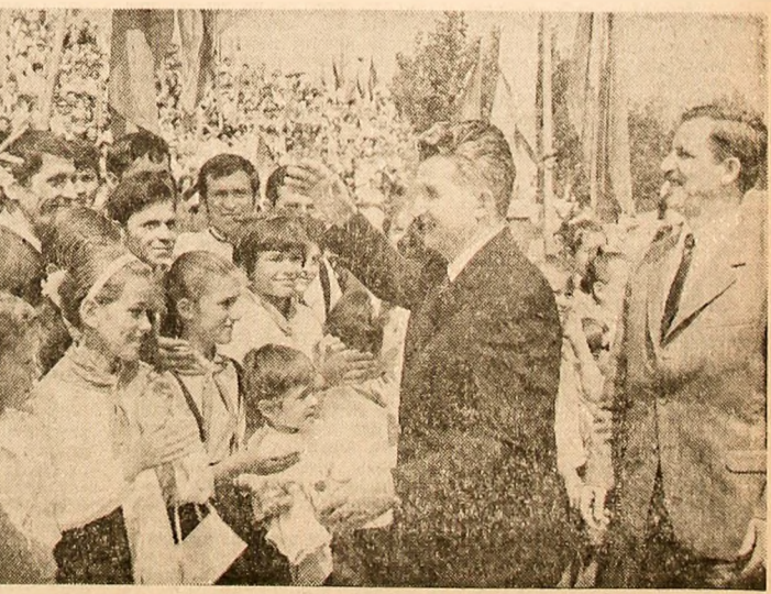
Trei imagini din filmul vizitei în județul Harghita: pretendenți, în orașele și centrele industriale vizitate, aceleași manifestări de dragoste fierbinte față de conducătorii de partid și de stat, în frunte cu tovarășul Nicolae Ceaușescu