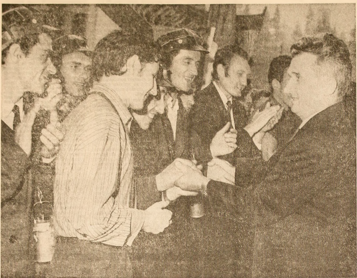
La Bălan, secretarul general al partidului este întâmpinat cu tradiționalul salut al minerilor: „Noroc bun!”