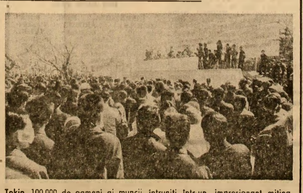
Tokio. 100.000 de oameni ai muncii, într-un impresionant miting, au demonstrat pentru îmbunătățirea condițiilor de muncă și de viață

HAGA. — Potrivit datelor oficiale publicate la Haga, prețurile mărfurilor de primă necesitate și al unor servicii publice au înregistrat în luna iulie cel mai înalt nivel din perioada de după cel de-al doilea război mondial. Olandezul plătește astăzi pentru carne, legume, fructe, electricitate și telefon cu 7,2 la sută mai mult decât cu cîteva luni în urmă.