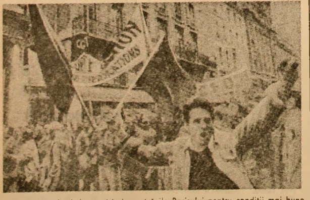
Franța. Muncitorii demonstrînd pe străzile Parisului pentru condiții mai bune de viață, pentru sporirea salariilor

Greva a fost declanșată ca urmare a refuzului autorităților de a satisface revendicările prezentate de sindicate și pentru a marca, totodată, solidaritatea cu muncitorii de la întreprinderea americană „Orinoco Mining”, situată în aceeași regiune, care au încetat lucrul de câteva săptămîni pentru a obține satisfacerea revendicărilor lor economice și sociale.