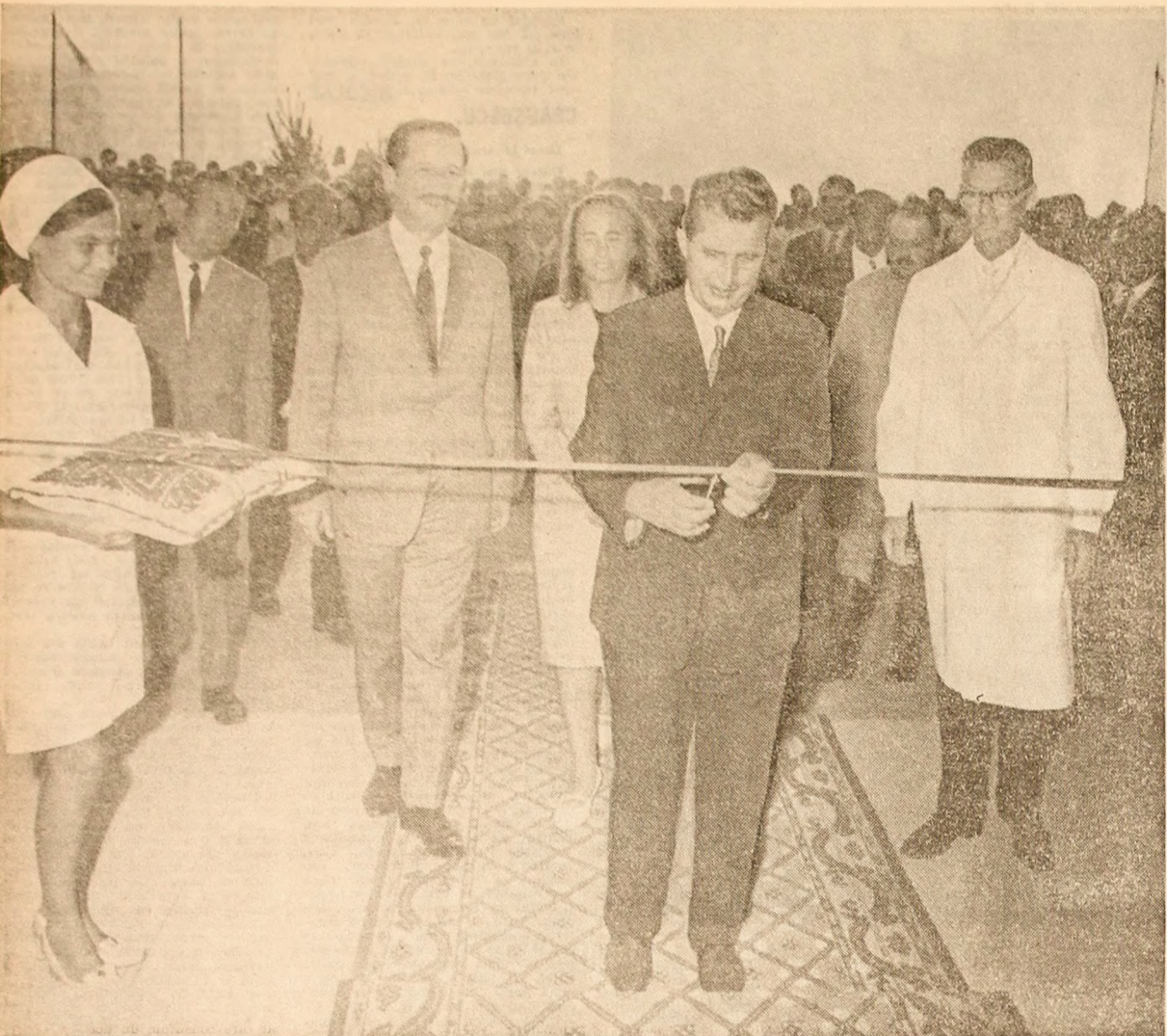
Tovarășul Nicolae Ceaușescu taie panglica inaugurând a spitalului din Miercurea Ciuc