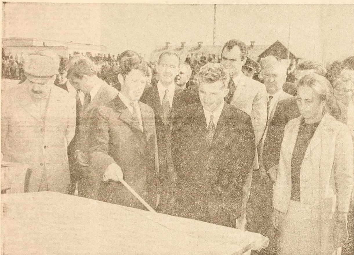
În fața planurilor viitoarelor întreprinderi industriale din Gheorghieni