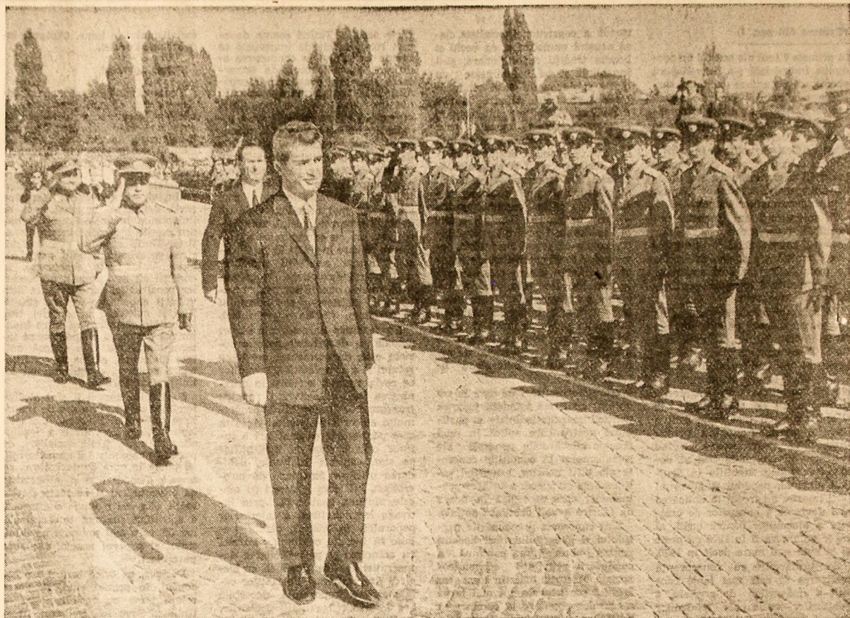
Tovarășul Nicolae Ceaușescu, comandantul suprem al forțelor noastre armate, trece în revistă unitățile de ofițeri

Trăiască colaborarea și prietenia dintre toate popoarele lumii! Trăiască pacea! (Aplauze puternice, prelungite, urale și ovaii). Se scandează minute în șir „Ceaușescu — P.C.R.". Cel prezenți la adunare ovaționează minute în șir pentru partid, pentru Comitetul său Central, pentru secretarul general al partidului, tovarășul Nicolae Ceaușescu).