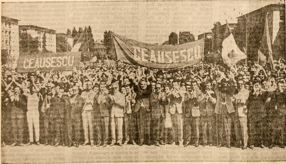
Aplauze, ovaii, urale pentru Partidul Comunist Român și conducerea sa, pentru secretarul său general, tovarășul Nicolae Ceaușescu