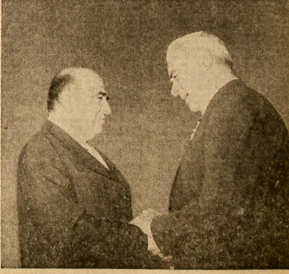
(Continuare în pag. a VI-a) La plecare, pe aeroportul Otopeni