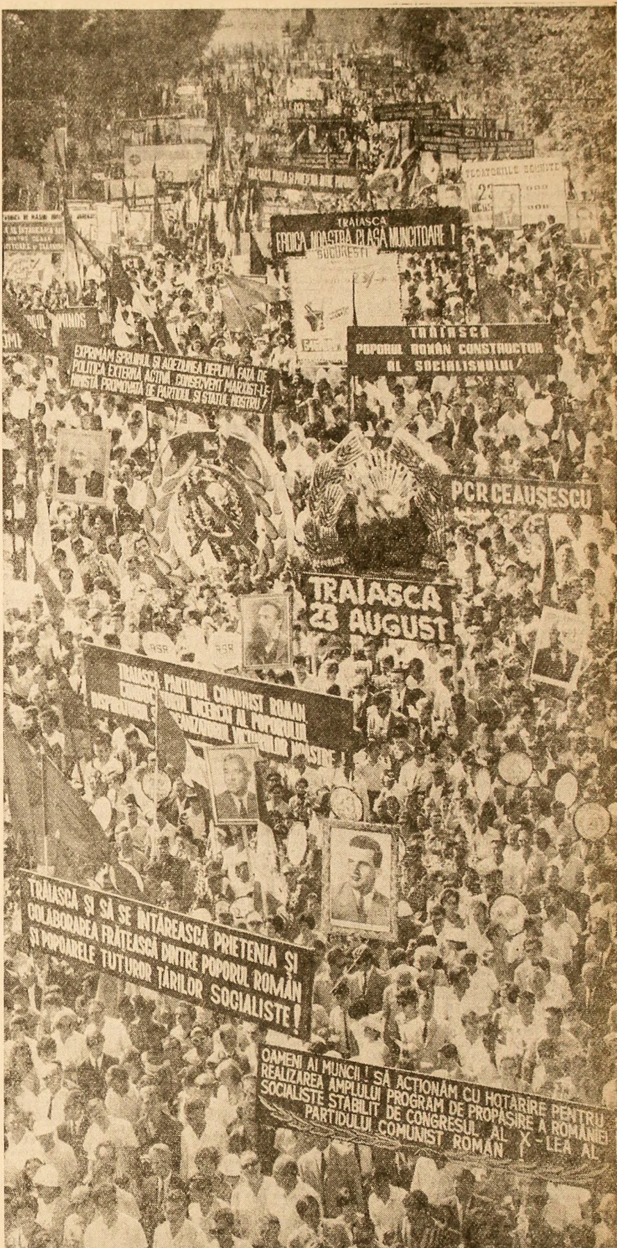
La grandioasa demonstrație din Capitală, oamenii muncii trec prin fața tribunelor, exprimîndu-și hotărîrea de a amplifica realizările dobîndite în cîntecul marelui sărbătorii, în împlinirea programului de propășire a patriei, stabilit de Congresul al X-lea al partidului