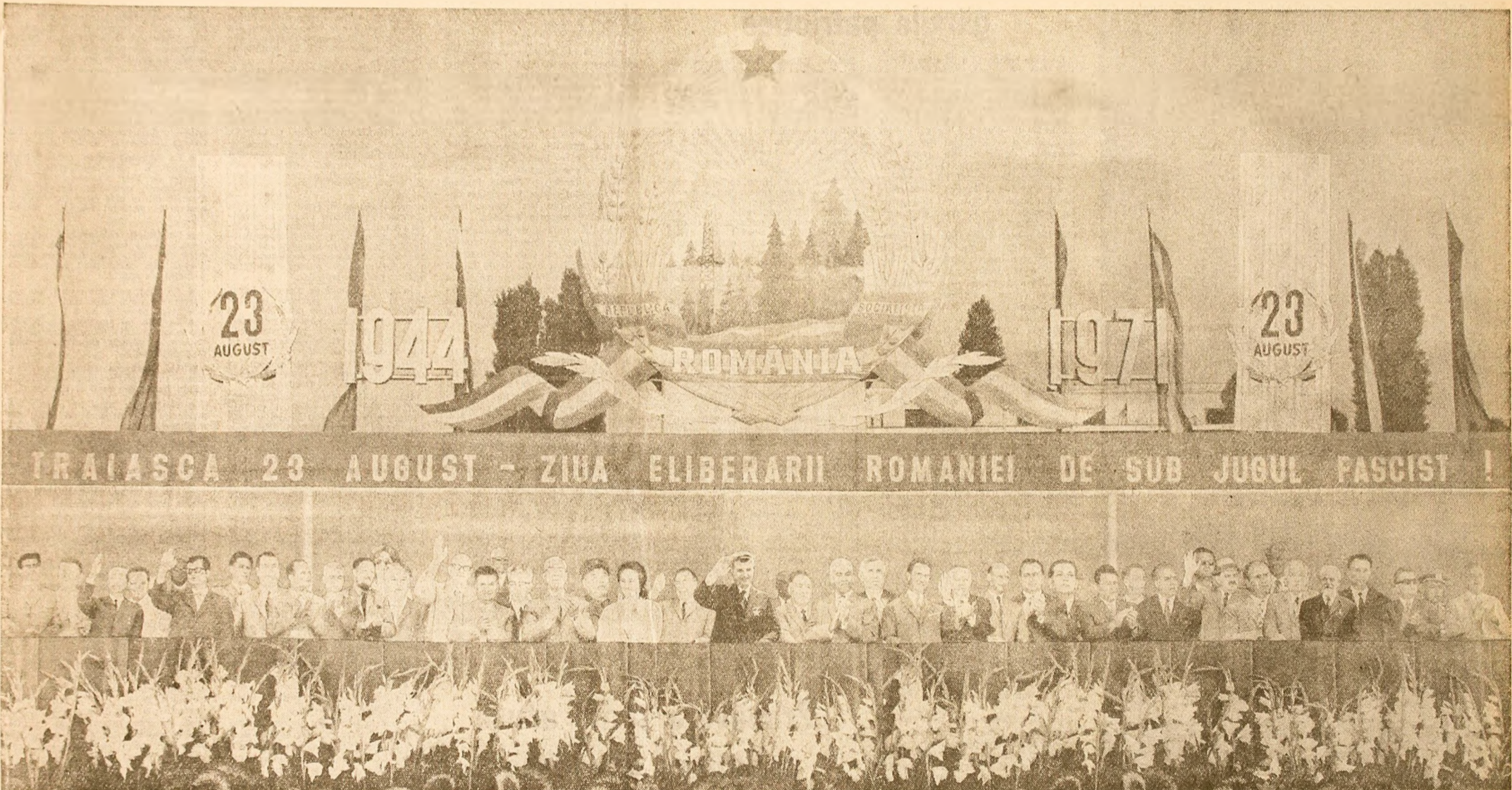
Tribuna centrală în timpul parăzii militare și demonstrației oamenilor muncii din Capitală