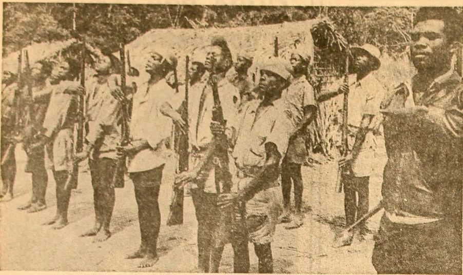
Patrioții din Angola continuă lupta de eliberare a țării de sub dominația colonialismului portughez. În fotografie: O unitate a patrioților înaintea plecării într-o nouă misiune de luptă