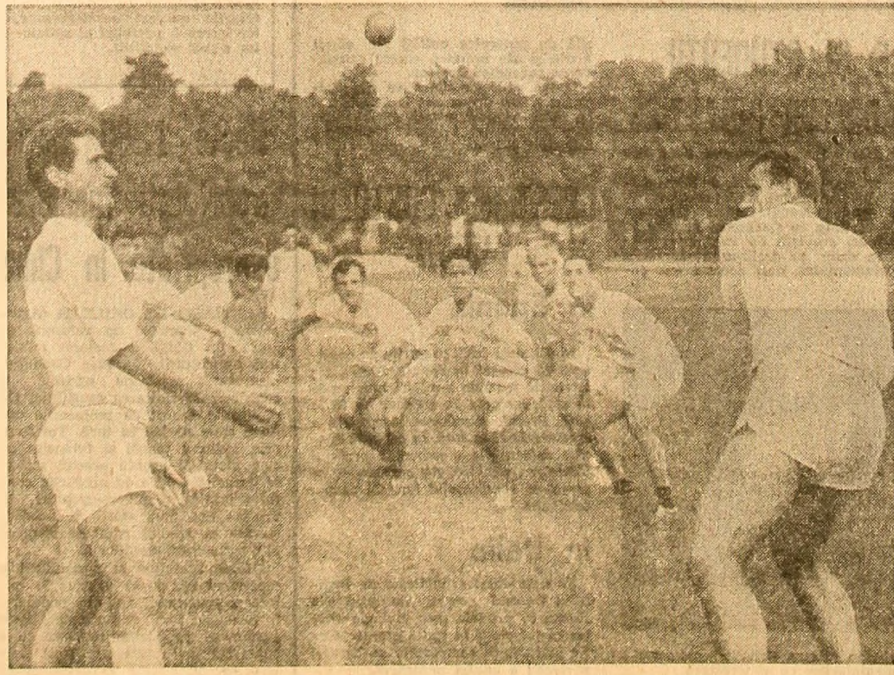
Oină - vechiul și frumosul nostru sport național - cu care ne întîlnim atît de rar

Controlul mai atent, la care au fost supuse secțiile din asociații și cluburi, prin noile măsuri adoptate de C.N.E.F.S. și F. R. Fotbal, ce stabilesc răspunderi directe pentru organele teritoriale sportive și în ce privește activitatea fotbalistică, trebuie să aibă în vedere, în cadrul procesului de instruire, în primul rînd, asigurarea acestui echilibru între preocupările pentru perfecționarea tehnică și tactică și cele pentru creșterea capacității de efort.